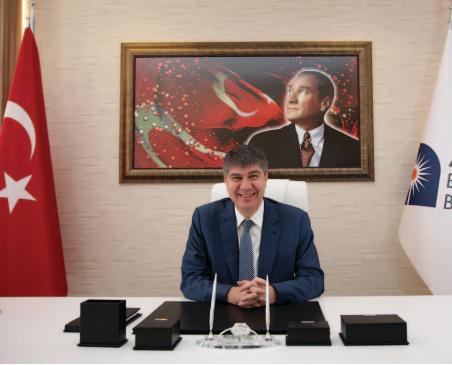
Menderes TÜREL Antalya Büyükşehir Belediye Başkanı