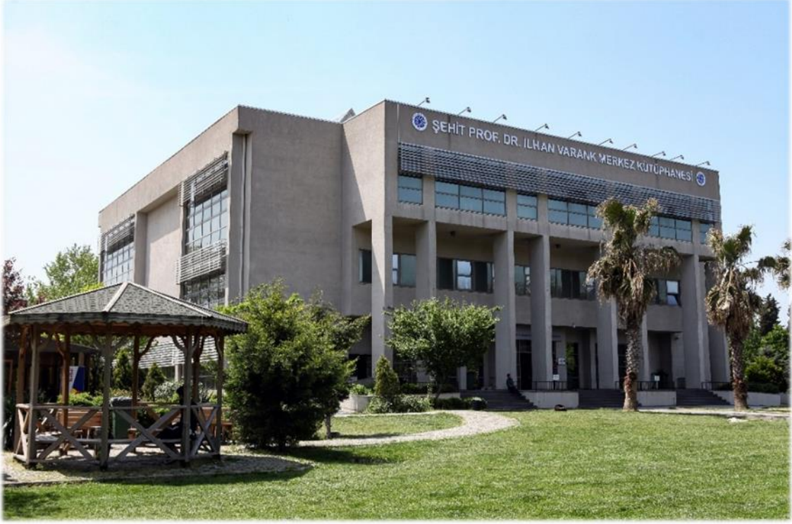
Şehit Prof. Dr. İlhan VARANK Merkez Kütüphanesi / Davutpaşa Yerleşkesi