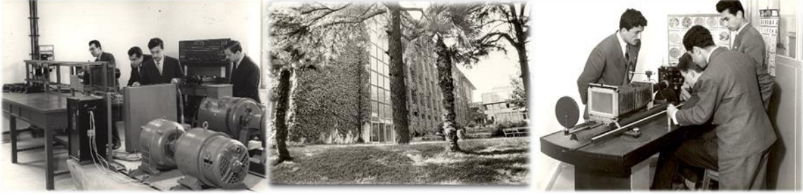
Geçmiş Yıllara Ait YTÜ Fotoğraf Arşivinden Yerleşke Ve Atölye Görünümleri