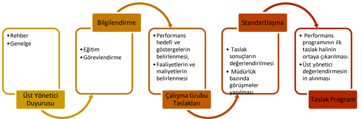
Şekil 3: Performans Programı Hazırlık Süreci

Kaynaklarla faaliyetler arasındaki ilişki iyi kurulmalı, kullanılacak olası oransal yöntemler tutarlı ve açıklana- bilir olmalıdır.