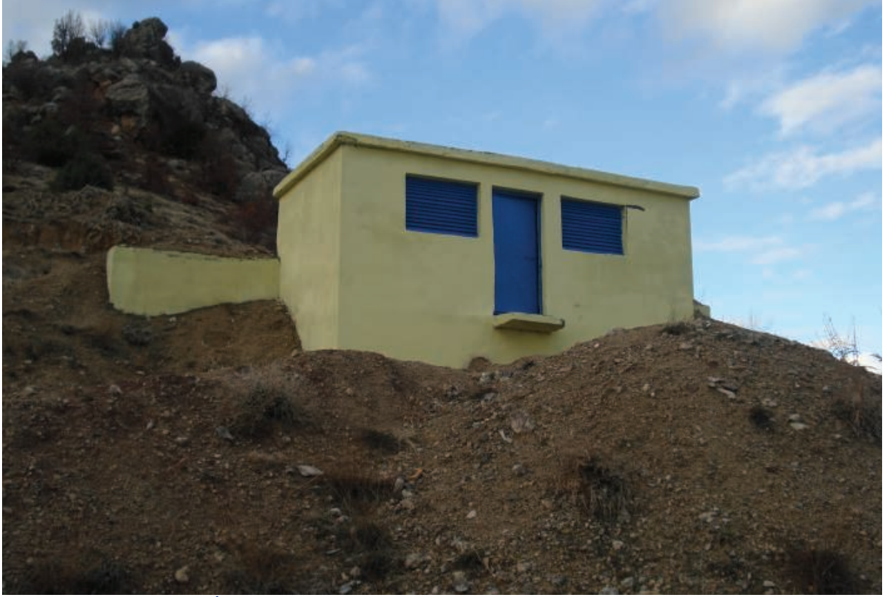
Merkez Kayatepe Köyü İçmesuyu Deposu