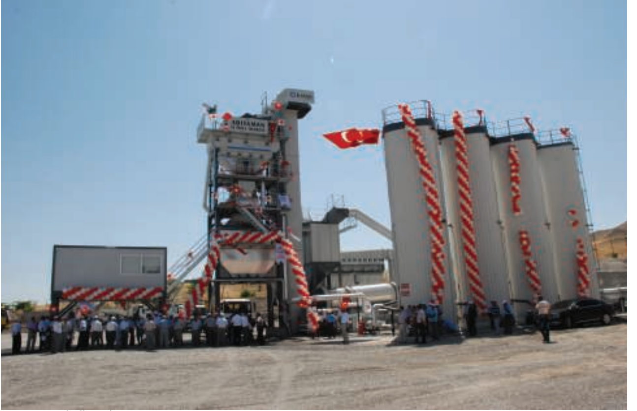
Adıyaman İl Özel İdaresi Asfalt Plenti Tesisini

Adıyaman İl Özel İdaresi asfaltlama çalışmalarında yaşanan sıkıntıları gidermek, az maliyetlerle daha çok iş yapmak için ihtiyaç duyulan Asfalt Plenti Tesisini 2012 mali yılı bütçesi ile 1.531.876,00 TL'ye tesis ederek 10 Temmuz 2012 tarihinde faaliyette geçirilmiştir.