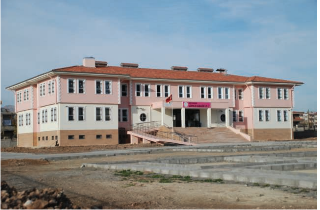
Merkez Sümer Evler Anaokulu