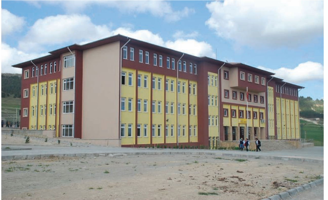
Merkez Fen Lisesi