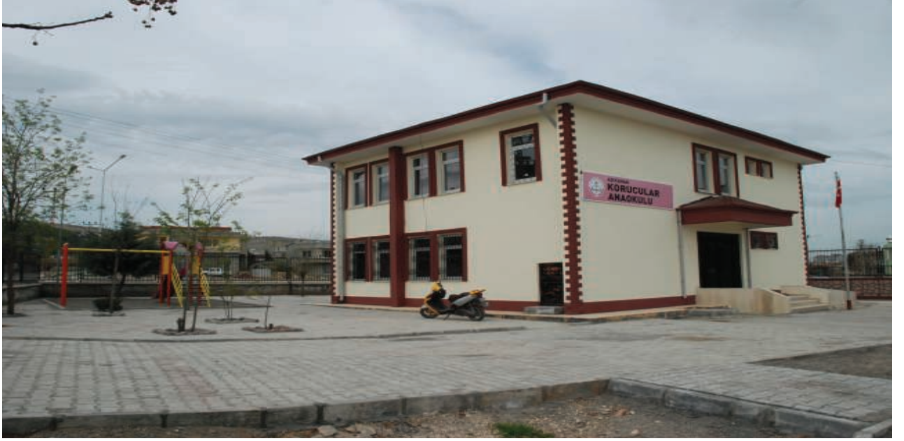
Merkez Korucular Anaokulu