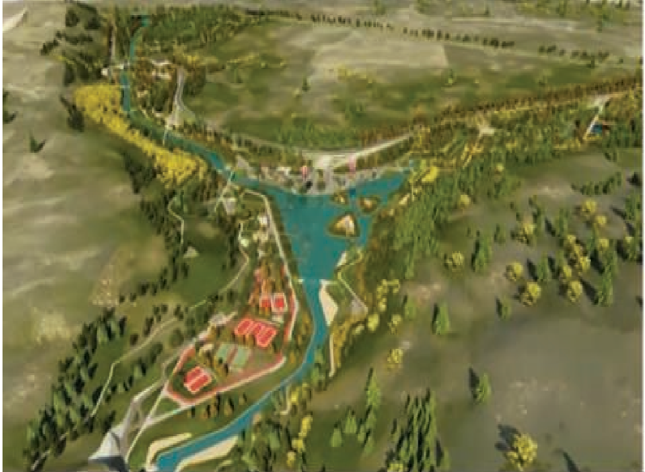
Abuzer Gaffari Ziyareti Mesire Alanı Rekreasyon Projesi

Abuzer Gaffari ziyareti mesire alanı Rekreasyon projesi ve kamulaştırma işi İmar ve Kentsel İyileştirme Müdürlüğümüzce yürütülmektedir.