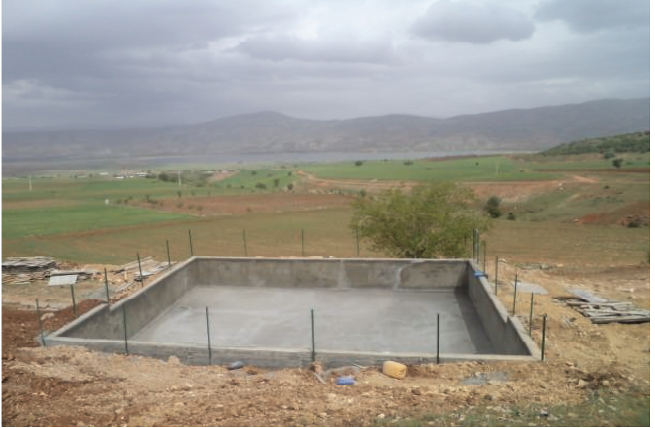
Gölbaşı Balkar Sulama Tesisi Havuz İnşaatı Çalışması-2012