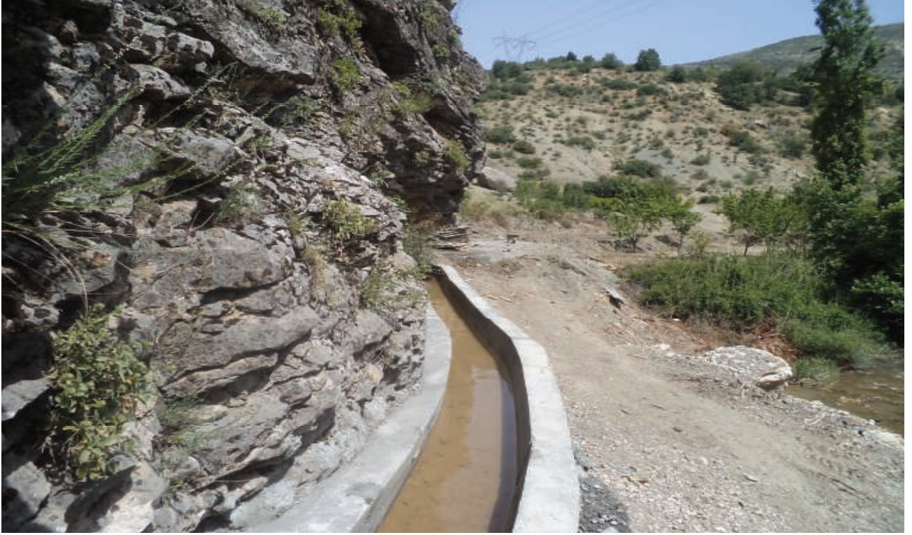
Besni Aşağıçöplü Sulama Tesisi Dik Kanal -2012