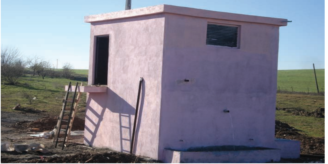
Samsat Gerçekleşti Köyü İçmesuyu Deposu