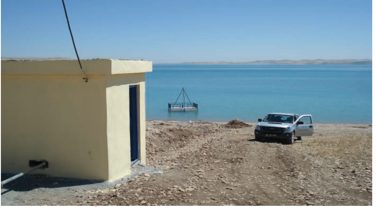
Samsat Kovanoluk Köyü İçmesuyu Deposu