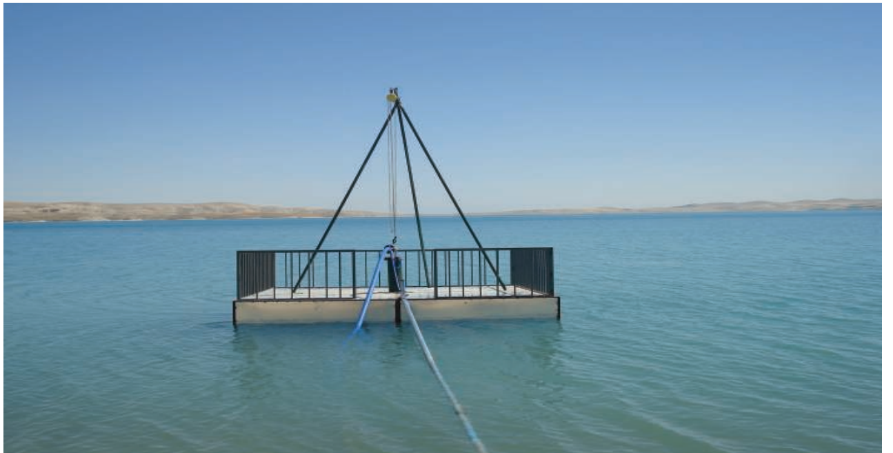
Samsat Kovanoluk Köyü İçmesuyu Deposuna Atatürk Barajından Su Alımı