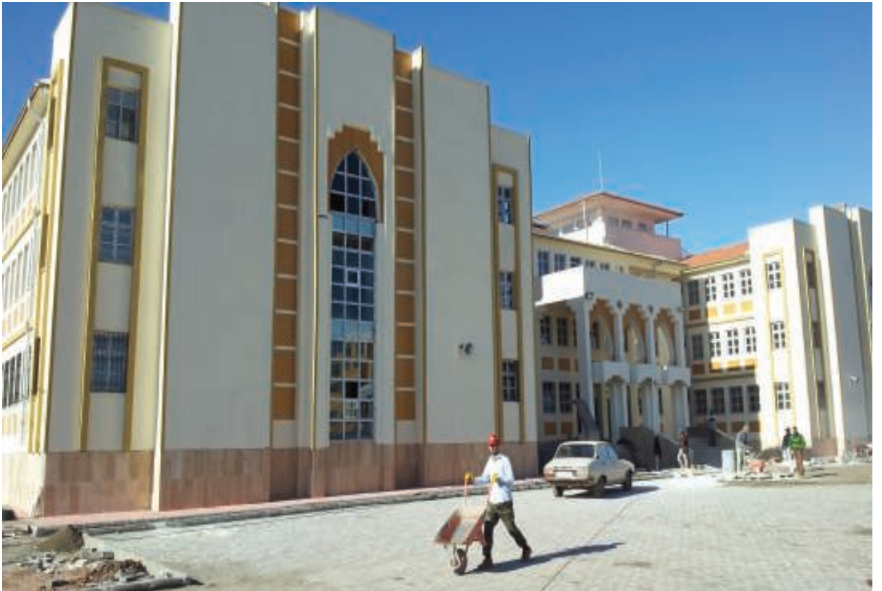
Kâhta Milli Piyango Lisesi