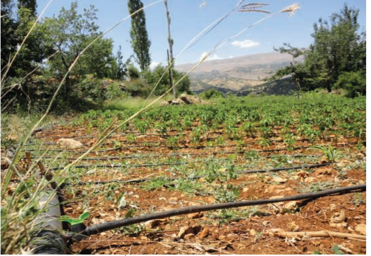
Gerger Çobanpınarı Köyünde Çiftçi İmkânlarıyla Yapılan Tarla İçi Damlama Sulama Tertibatı