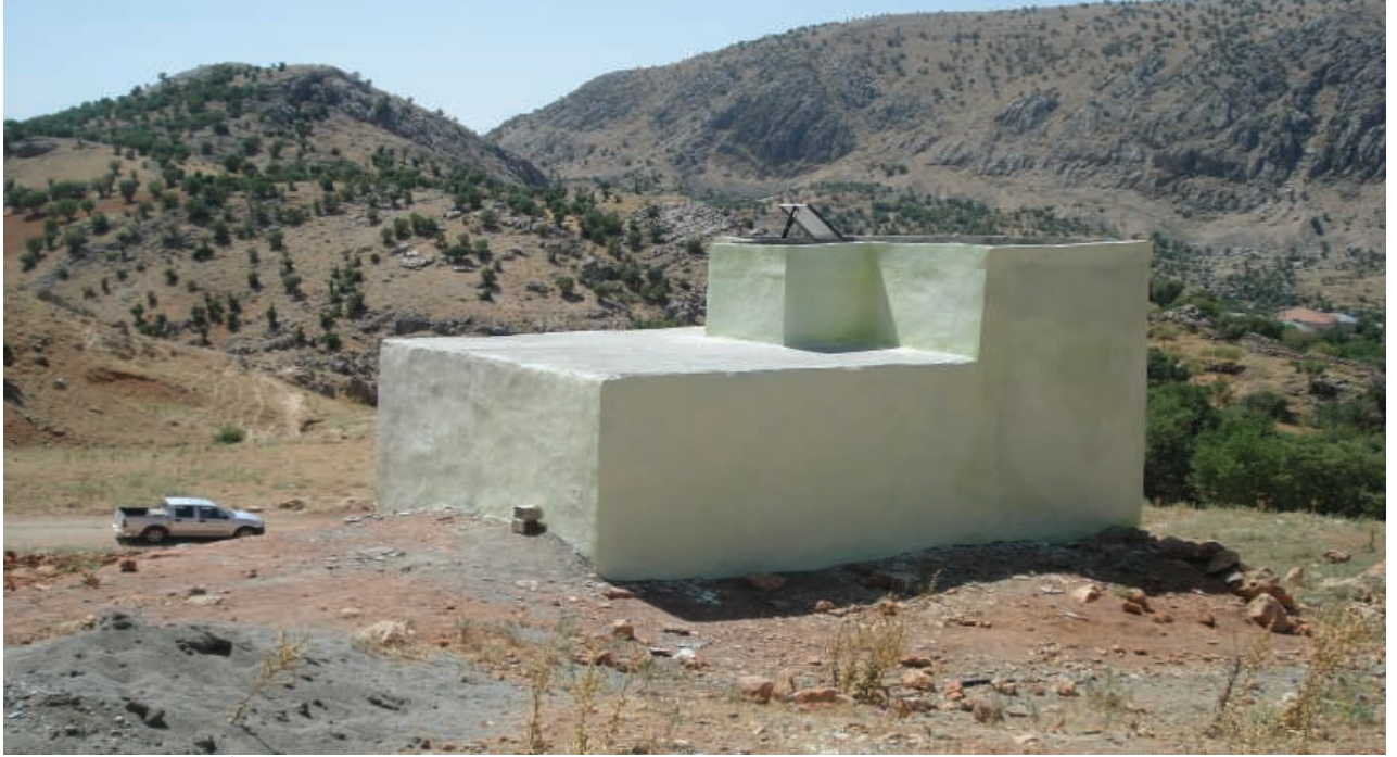
Kâhta Sırakaya İçmesuyu Deposu