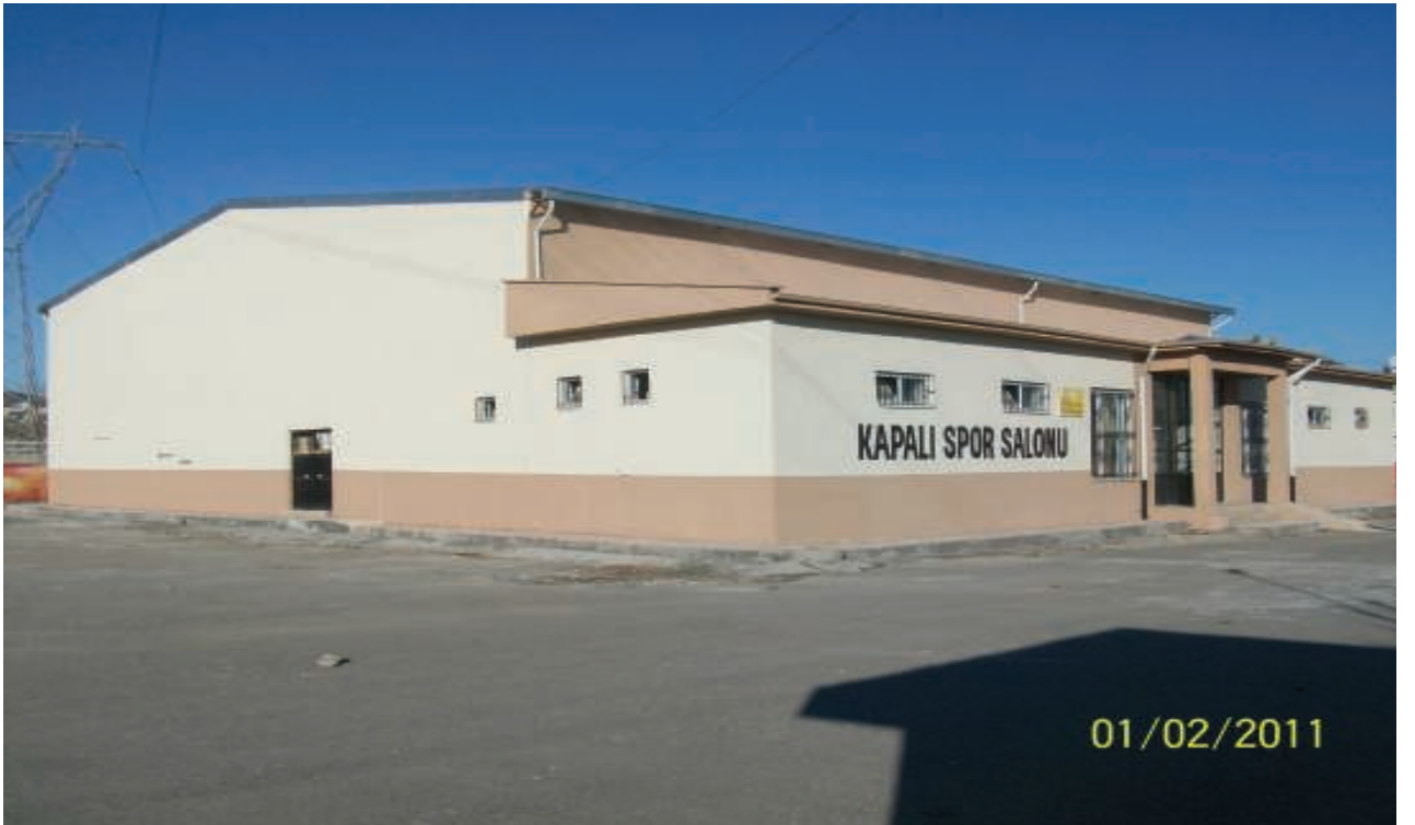
Merkez Erdemir Lisesi Kapalı Spor Salonu