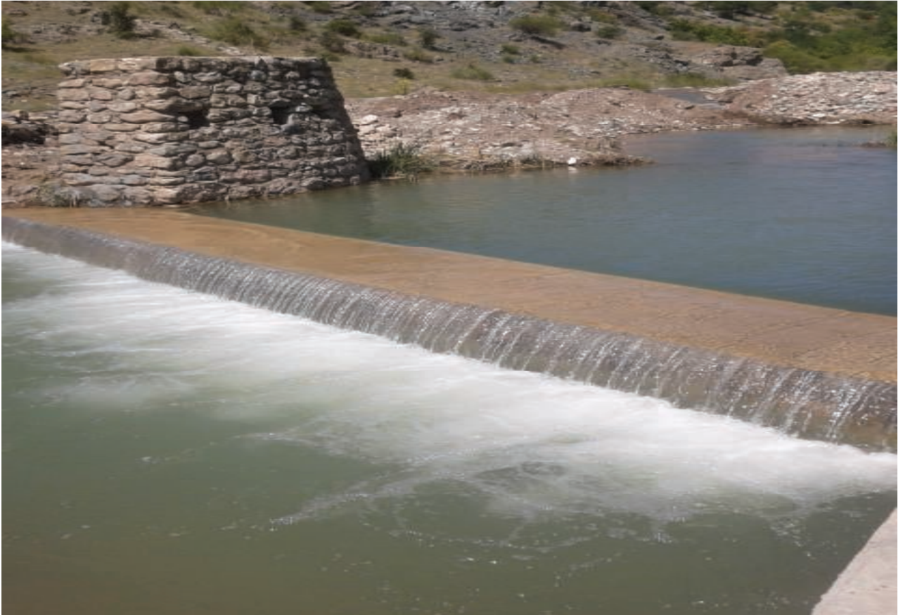
Besni Aşağıçöplü Sulama Tesisi Su Alma Yapısı-2012