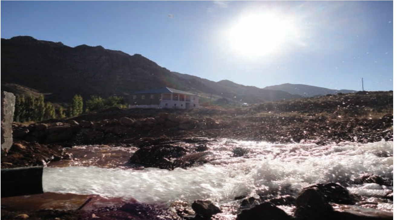
Gerger Çat Sulama Tesisi Tarlabası Rögarından Suyun Alınması-2012

Tarımsal Hizmetler Müdürlüğünce 2012 yılı içerisinde yapılan ön etüt çalışmaları yukarıdaki tabloda verilmiştir. Tarımsal Hizmetler Müdürlüğü 2012 yılı ön etüt çalışmaları kapsamında ön etütleri olumlu görülen yerlerin tahmini ödenek ihtiyaçları çıkarılmış olup, 2013 yılı teklif programında değerlendirilmek üzere İl Genel Meclisinin takdirine sunulmuş olup yatırım programına alınanlar projelendirilecektir.