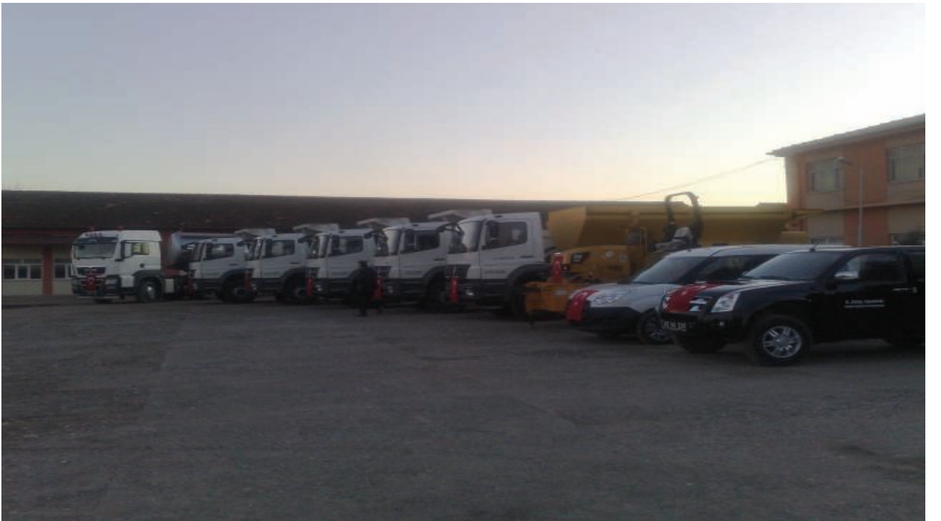
İl Özel İdaresine Alınan İş Araçları

İdarenin asfaltlama çalışmalarında azami verimi elde etmesi için ihtiyaç duyduğu, kasalı kamyon, silindir gibi iş araçları 2012 mali yılı bütçesinin mali olanakları ölçüsünde temin edilerek araç parkı güçlendirilmiştir.