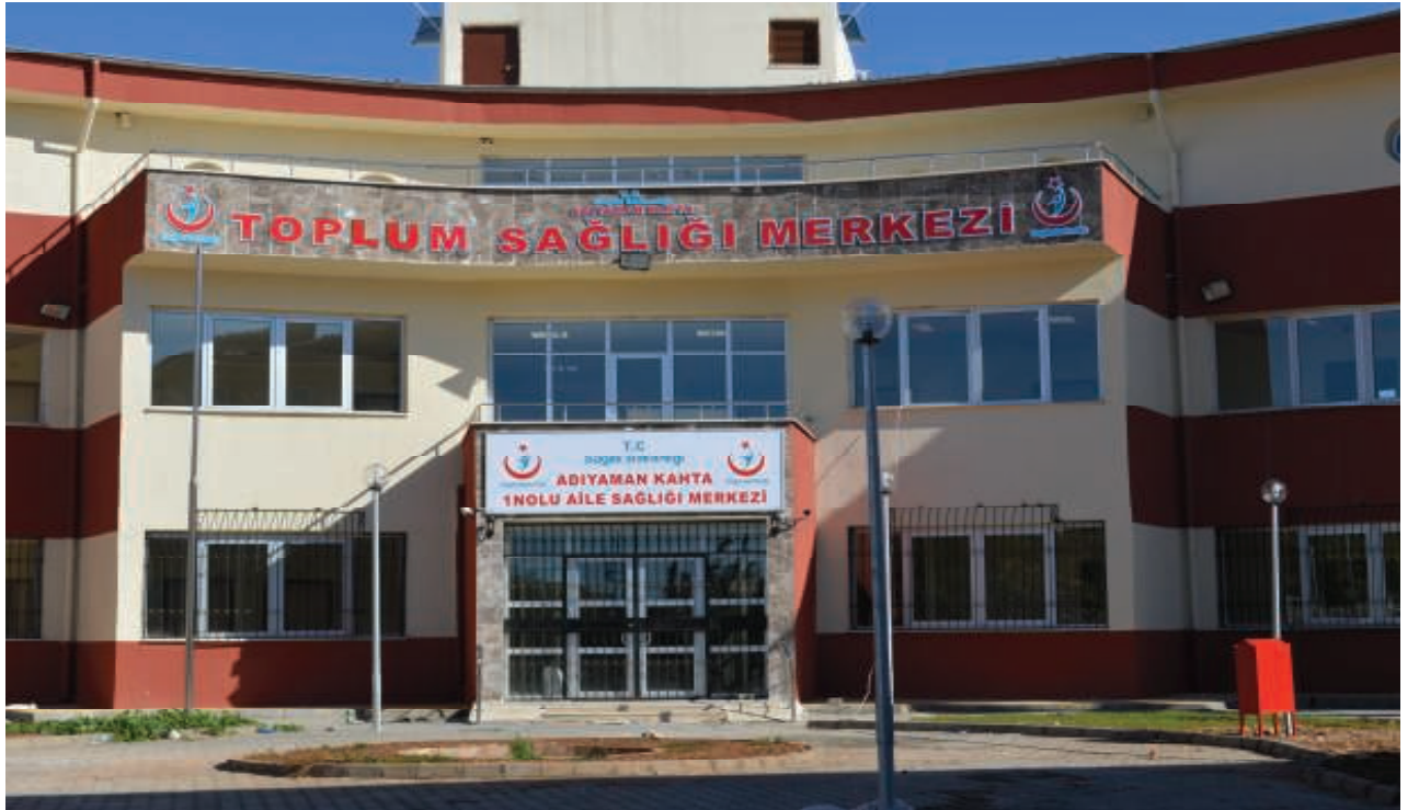
Kâhta Aile Sağlık Merkezi