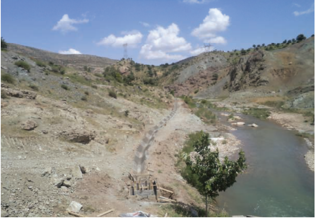
Besni Aşağıçöplü Sulama Tesisi Beton Kanal İnşaatı-2012