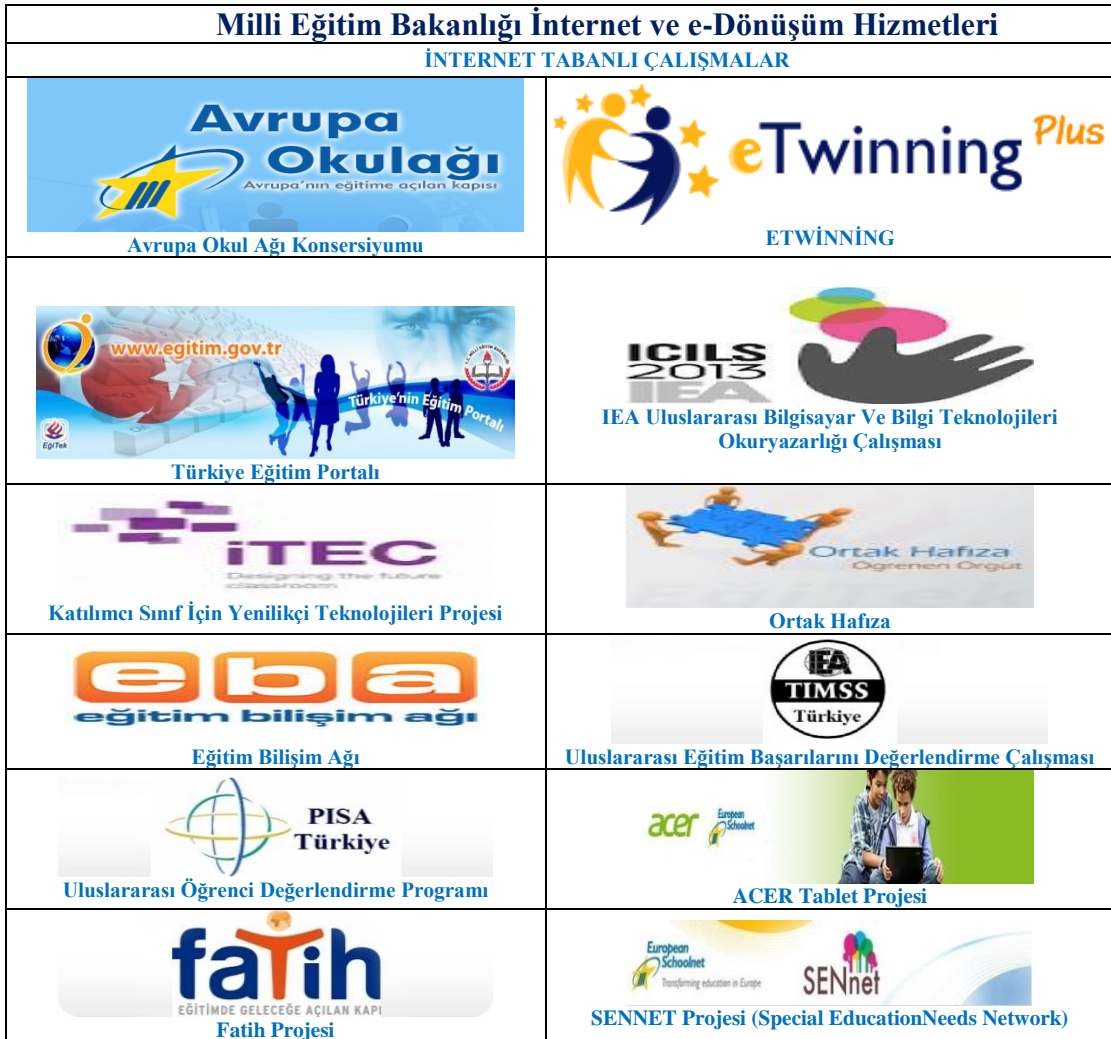
Tablo 1: WEB Tabanlı Çalışmalar

Bakanlığımız internet ve e dönüşüm hizmetleri kapsamında yapılan çalışmalardan bazılarının görselleri aşağıda gösterilmiştir.