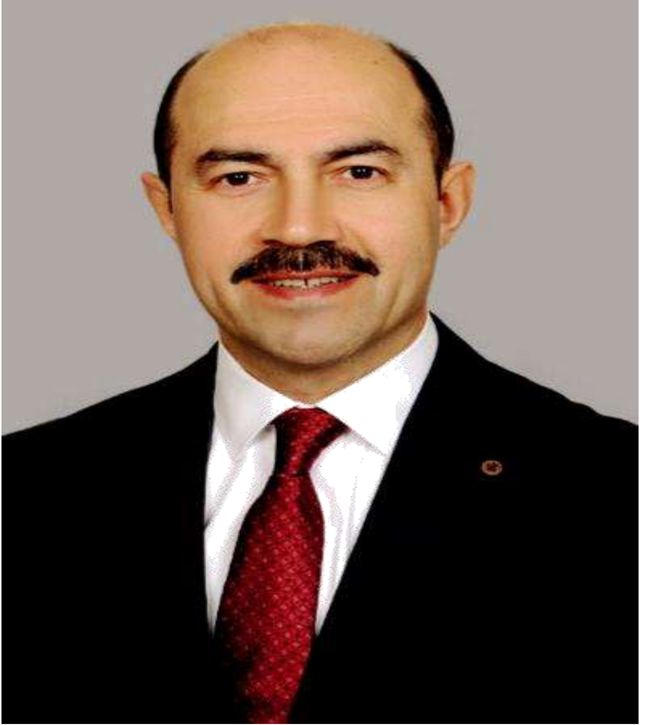
Ali KILIÇ Terme Belediye Başkanı