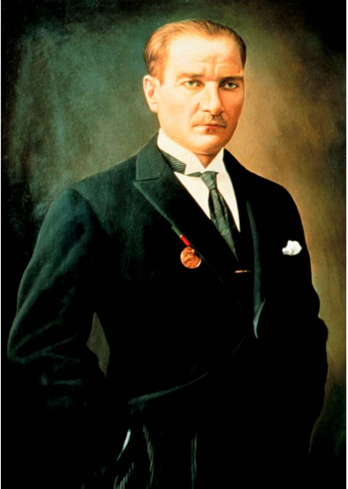
Mustafa Kemal ATATÜRK