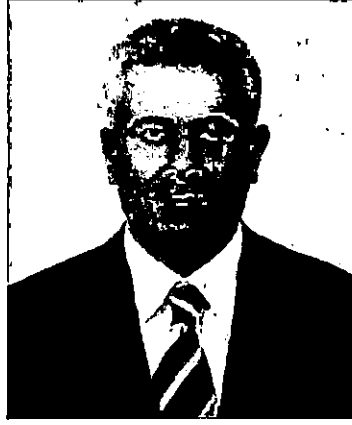
Çınar Belediye Başkanı Mimar Ahmet CENGİZ