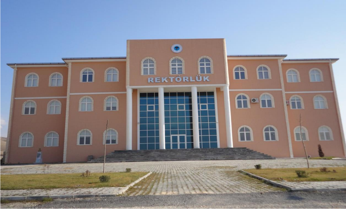
BATI RAMAN KAMPÜSÜ REKTÖRLÜK HİZMET BİNASI