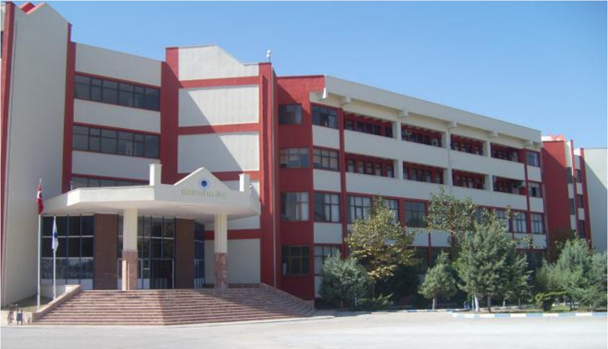
MERKEZ KAMPÜSÜ REKTÖRLÜK HİZMET BİNASI