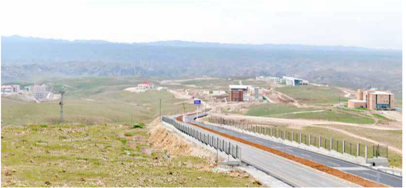
Batı Raman Kampüsü