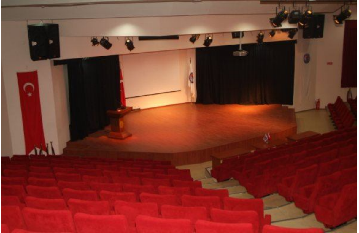
Resim - 3: Troia Kültür Merkezi.