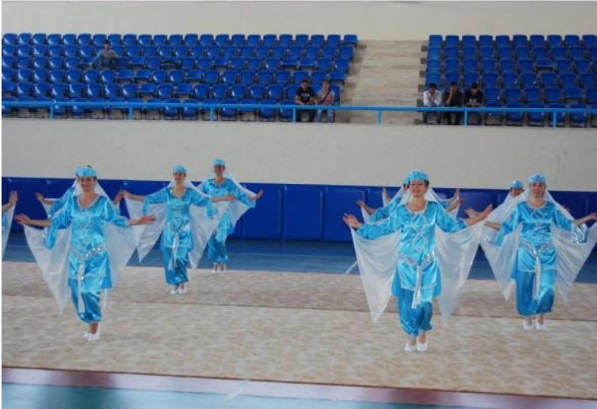
Resim - 7: Halk Dansları Topluluğunun Gösterisi.