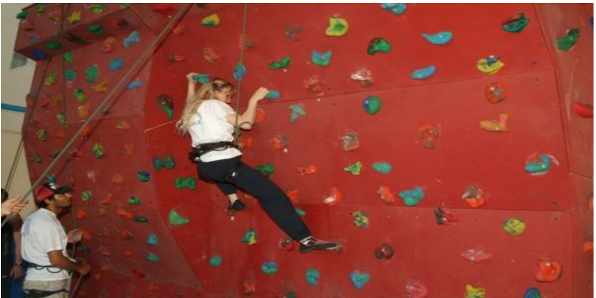
Resim – 6: Dağcılık Topluluğu Etkinliği.