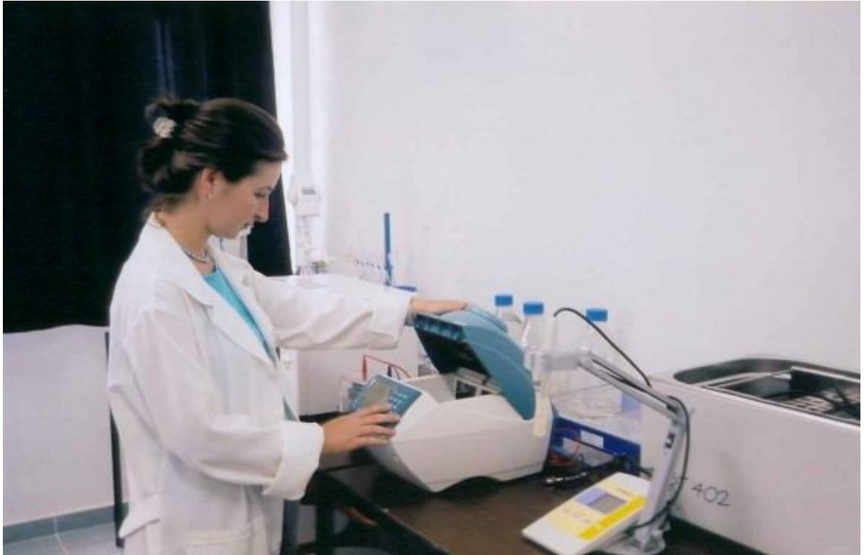
Resim –9: Mediko’ dan Görüntüler.