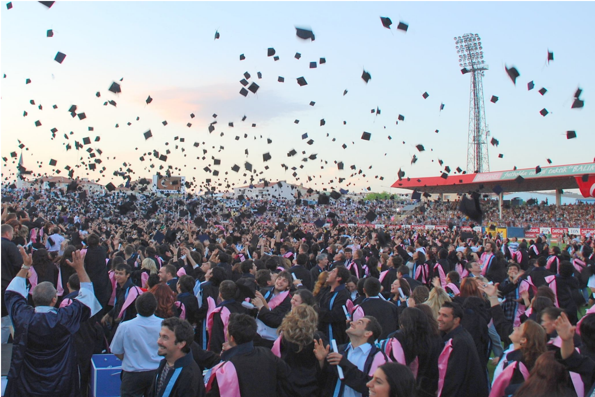
Resim - 5: Üniversitemiz 2008-2009 Eğitim Yılı Mezuniyet Töreni.