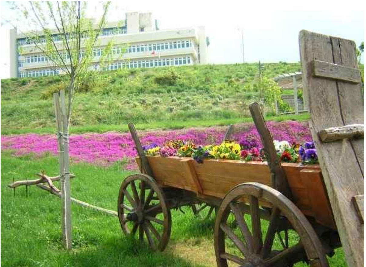
Resim -1: Üniversitemiz Terzioğlu Yerleşkesinden görüntüler.