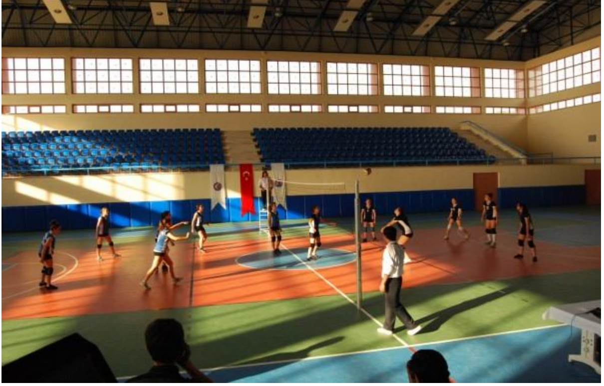
Resim - 2: Üniversitemiz Spor Salonundan Görüntüler.