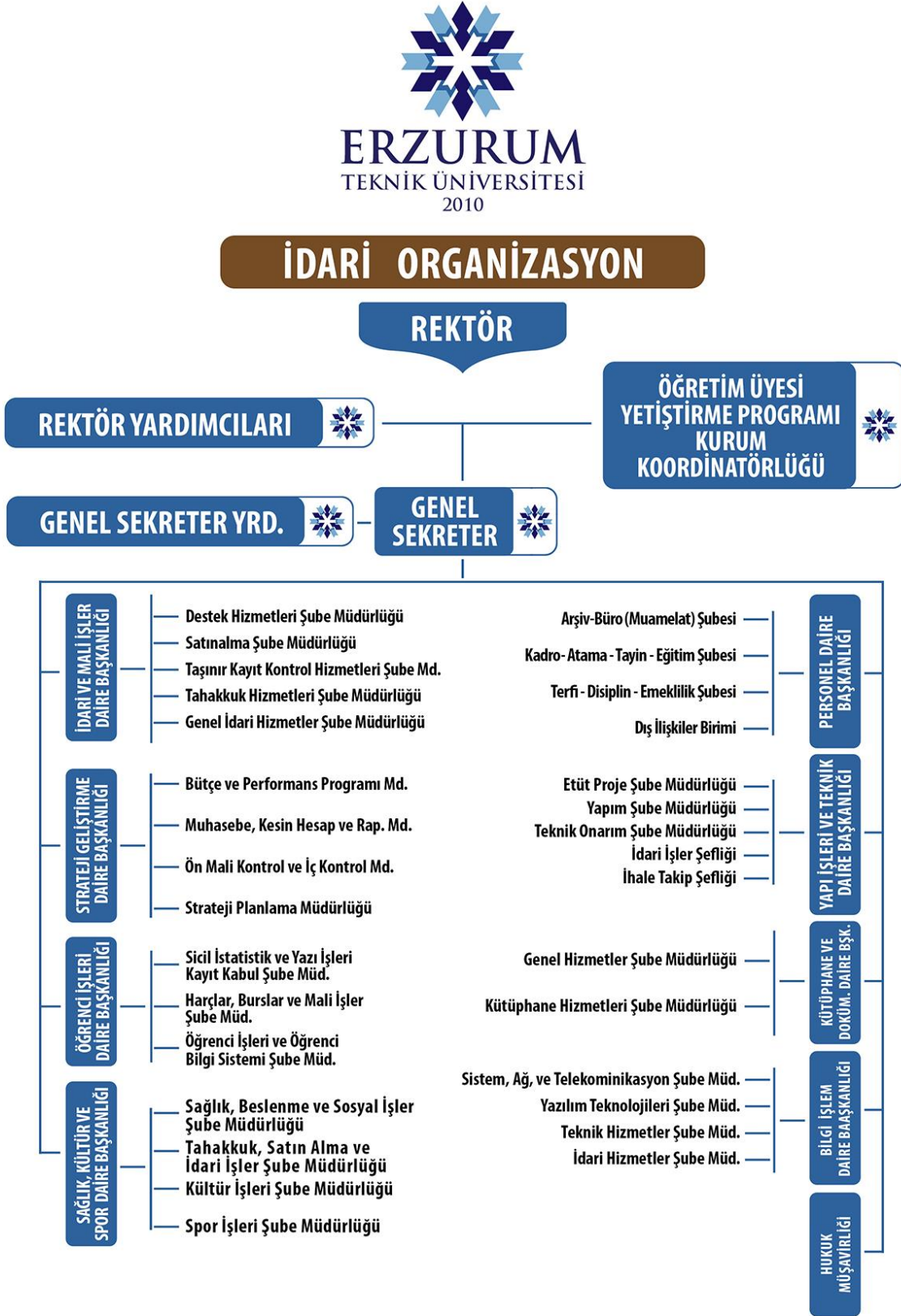
Şekil 2: Erzurum Teknik Üniversitesi Rektörlük Örgütü İdari Birimler Organizasyon Şeması