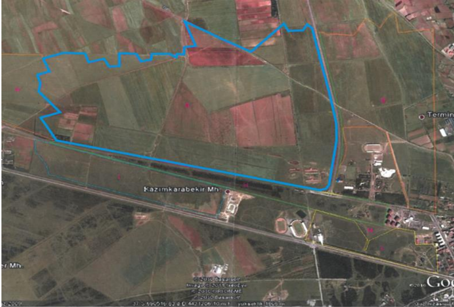
Resim 1: Erzurum Teknik Üniversitesi Kampüs Alanı