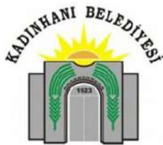
Konya Kadınhanı Belediyesi