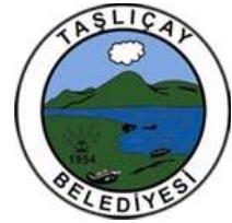
Ağrı Taşlıçay Belediyesi