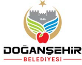
Malatya Doğanşehir Belediyesi