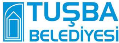
Van Tuşba Belediyesi