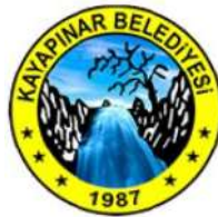
Batman Kayapınar Belediyesi