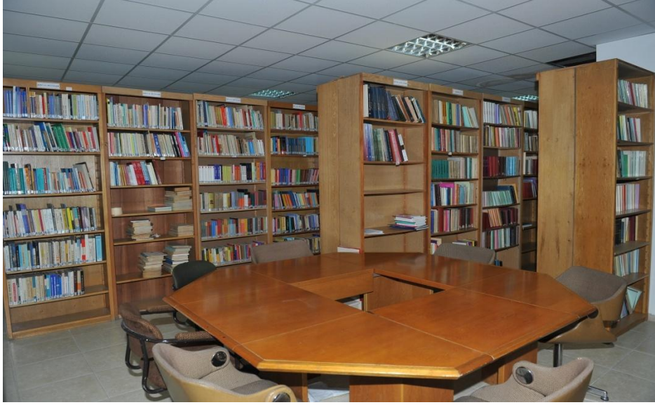
BYEGM Kütüphanesinden Görünüm

Kitaplar içinde ağırlıklı olarak Devlet Yıllığı niteliği taşıyan "Osmanlı Devlet Salnameleri" yer almaktadır. Salnamelerin en eski tarihlisi 1872 ve en yeni tarihlisi ise 1917-1918 olmak üzere toplam 37 adettir. Ayrıca 1925-1926, 1926-1927, 1927-1928 tarihlerini taşıyan 3 adet T.C. Devlet Salnamesi bulunmaktadır.