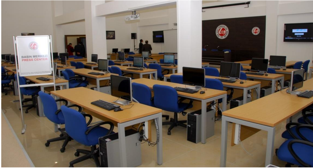
BYEGM Basın Merkezinden Görünüm

Genel Müdürlük binasında oluşturulan basın merkezi, yerli ve yabancı basın mensuplarının önemli olayları ve gelişmeleri daha uygun ortamda izlemeleri amacıyla kurulmuştur. Basın Merkezi ilk olarak 29 Mart 2009 Mahalli İdareler Seçiminde kullanılmıştır.