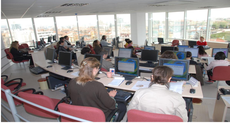
Haber Dairesi Başkanlığı Faaliyetleri Bir Görünüm

Türkiye’de 2009 yılında Hükümet tarafından başlatılan demokratik açılımlar ve bu konudaki tartışmalar, terör örgütünün başı Abdullah Öcalan’ın İmralı’daki yaşam koşullarıyla ilgili olarak Güneydoğu’da yapılan protestolar, Tokat Reşadiye’de 7 Türk askerinin şehit edilmesi, Demokratik Toplum Partisi (DTP)’nin kapatılması ve buna ilişkin protestolar, Ergenekon soruşturmasında gözaltılar, duruşmalar, çeşitli yerlerdeki kazılarda bulunan silahlar, yargı mensuplarının ve Yargıtay’ın dinlenme iddiaları, askeri yetkililerin çeşitli vesilelerle yaptığı açıklamalar ve Devlet Bakanı ve Başbakan Yardımcısı Bülent ARINÇ’a suikast girişimi iddiaları ve buna ilişkin yaşanan gelişmeler yabancı basın yayın organlarının ağırlıklı olarak ele aldıkları konuların başında gelmiştir. Davos’ta düzenlenen Forum’daki “Gazze” konulu oturumda Başbakan Recep Tayyip ERDOĞAN’ın tepkisi üzerine yaşanan gelişmeler, ABD Başkanı Barack Hüseyin Obama’nın başkan seçildikten sonra ilk ziyaretini Türkiye’ye yapması, İstanbul’da yapılan Medeniyetler İttifakı Toplantısı, Başbakan ERDOĞAN’ın ABD, Orta Doğu ve Türkiye’ye komşu ülkelere yıl içinde yaptığı ziyaretler, Dışişleri Bakanı Prof. Dr. Ahmet DAVUTOĞLU’nun dış ülkelere ziyaretleri, Nabucco Projesinin Hükümetlerarası Anlaşmasının İstanbul’da imzalanması, Ermenistan-Türkiye arasındaki ilişkiler ve ortak sınırın açılmasına yönelik gelişmeler yabancı basın yayın organlarının önemli oranda ilgi duyduğu dış politika konularını oluşturmuştur.