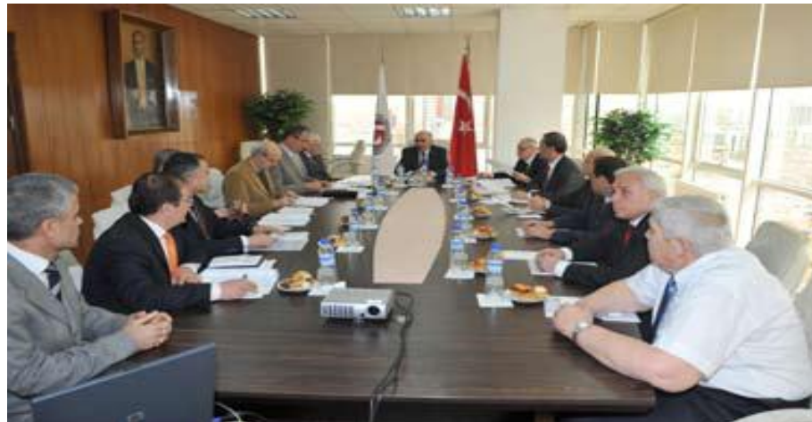
Basın Kartı Komisyonu Toplantısından Bir Görünüm

Basın kartı başvurusunda bulunan ve üzerinde işlem yapılan tüm dosyaların arşiv düzenlemesi ve güncellemesi çalışmaları yapılmış, basın mensuplarının kart kullanımı konusundaki talepleri karşılanmıştır. Yerel basın kuruluşları tarafından gönderilen gazete ve dergilerin bilgisayar ortamında arşivlenmesi sağlanmıştır.