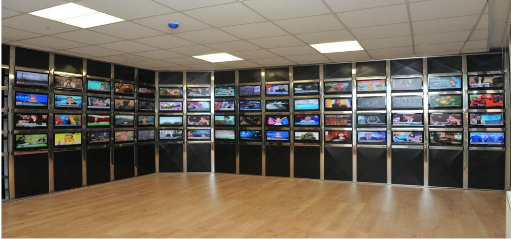
Devlet Enformasyon Takip Biriminden Bir Görünüm