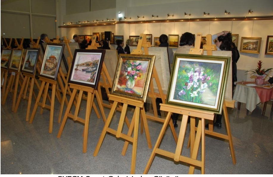
BYEGM Sanat Galerisinden Görünüm