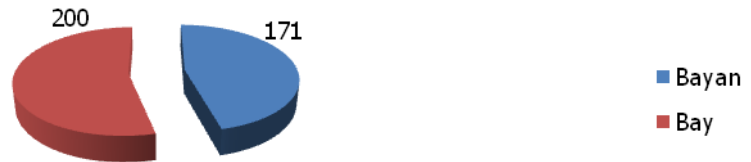
Personelin Cinsiyet Grafiği