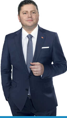
Mesut KÖSEDAĞI Kadıköy Belediye Başkanı