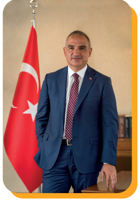
Mehmet Nuri ERSOY Kültür ve Turizm Bakanı

2024 yılında yapacağı çalışmalara yön vermesi amacıyla şeffaflık ve hesap verebilirlik ilkesi çerçevesinde hazırlanan Atatürk Kültür, Dil ve Tarih Yüksek Kurumu 2024 Yılı Performans Programı'nın başarıyla uygulanmasını ve ülkemizin kültür alanındaki kalkınmasına katkı sağlamasını temenni ediyorum.