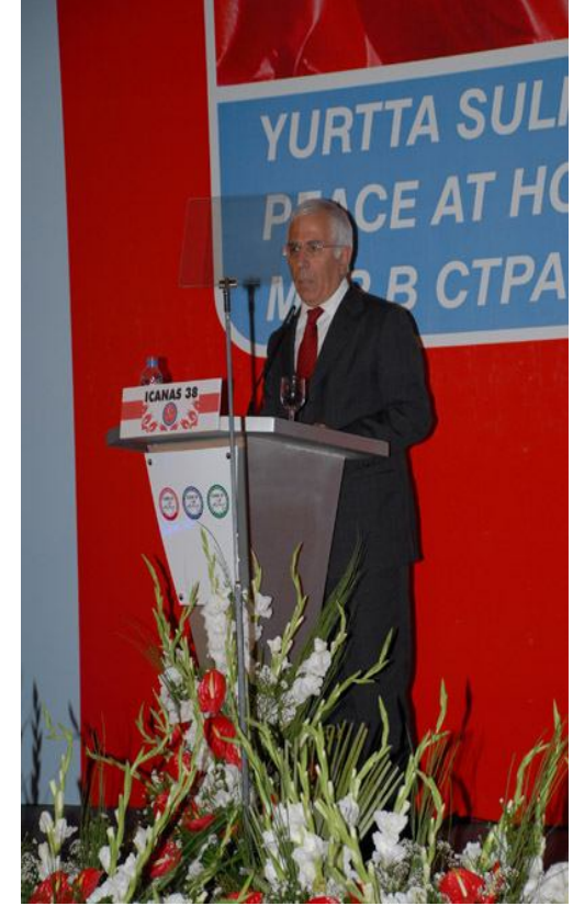
Prof. Dr. Mehmet AYDIN Devlet Bakanı

5018 sayılı Kamu Mali Yönetimi ve Kontrol Kanunu ile idarelere yıllık faaliyet raporu hazırlama görevi verilmiş olup, Bakanlığımıza bağlı Atatürk Kültür, Dil ve Tarih Yüksek Kurumunun, 2008 yılı çalışmalarının yer aldığı faaliyet raporu hazırlanmıştır. Hazırlanan bu raporu ve gerçekleştirilen faaliyetleri bilim ve düşünce dünyamızın, kamuoyumuzun ilgi ve bilgisine saygıyla sunuyorum.