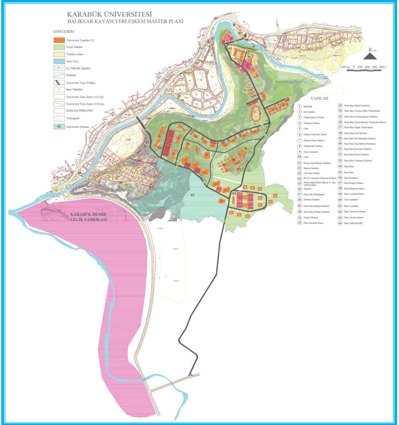
Resim 2 Karabük Üniversitesi Demir Çelik Yerleşkesi Master Planı