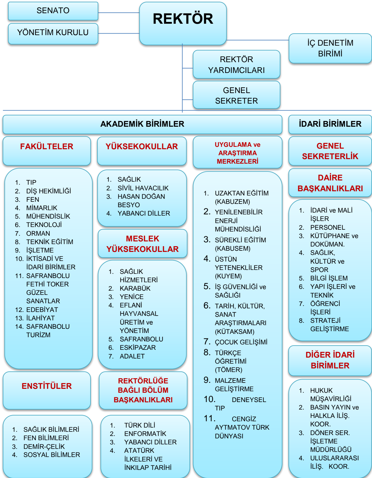
Şekil 1 Teşkilat Şeması