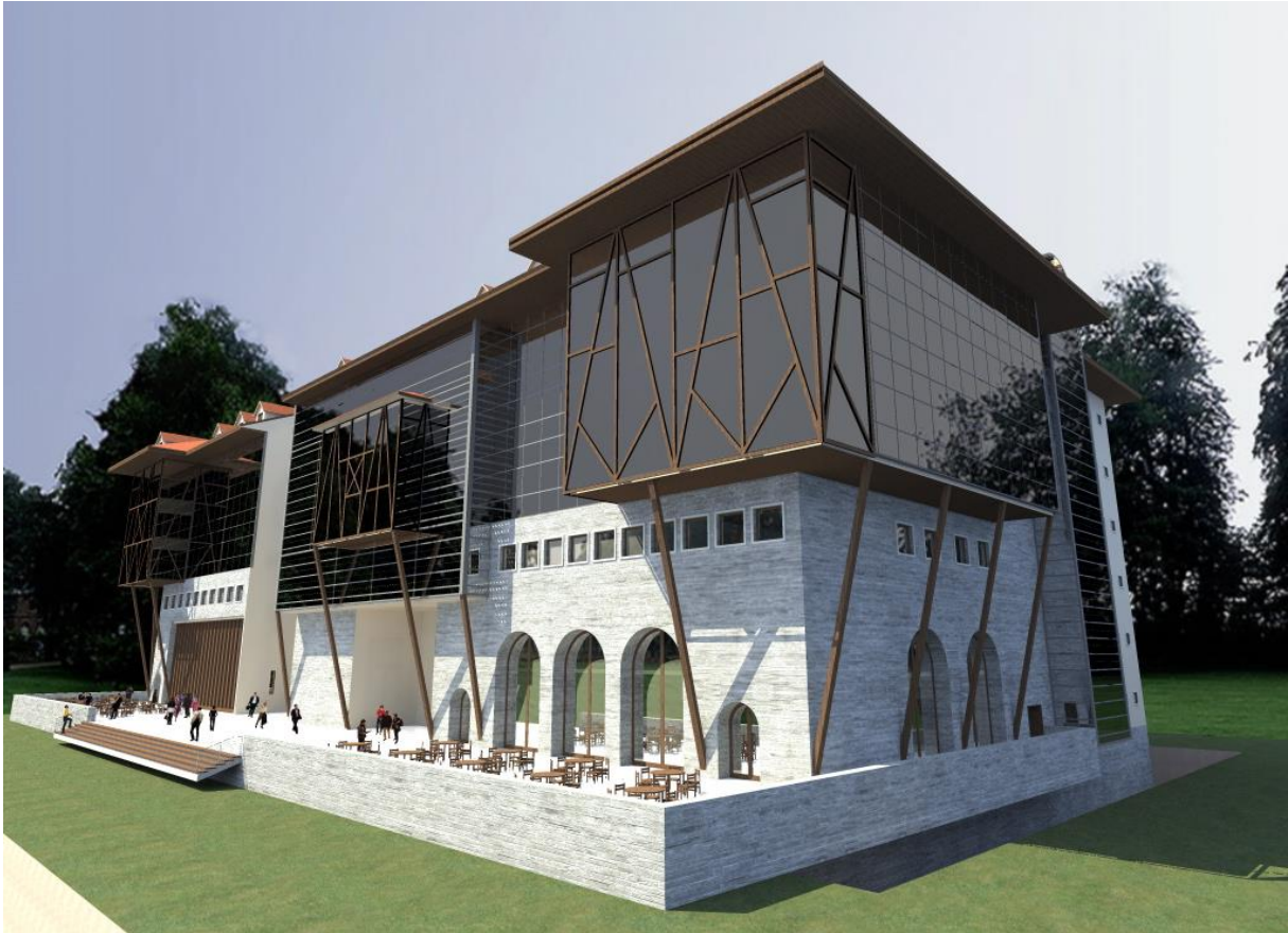
Resim 5 Turizm Fakültesi ve Güzel Sanatlar ve Tasarım Fakültesi Binası

Safranbolu yerleşkesinde 4.780 m 2 açık alan, 5.698 m 2 kapalı alana sahip Safranbolu Meslek Yüksekokulu, 800 m 2 kapalı alanı bulunan ahşap atölyesi, 3.000 m 2 alan üzerinde 360 m 2 kapalı alanı bulunan Uygulama Oteli 1 (Tarihi Çiçekler Evi), 780 m 2 alan üzerinde 455 m 2 kapalı alanı bulunan Uygulama Oteli 2 (Tarihi Antepler Konağı), 2014-2015 Eğitim-Öğretim dönemi sonuna kadar Safranbolu Turizm Fakültesi Dekanlık Binası olarak kullanılan 2.000 m 2 açık alan üzerinde 848 m 2 kapalı alanı bulunan tarihi Taş Bina bulunmaktadır. 5.949 m 2 açık alan, 800 m 2 oturma alanı ve 22.400 m 2 kapalı alana sahip Safranbolu Fethi Toker Güzel Sanatlar ve Tasarım Fakültesi ve Safranbolu Turizm Fakültesi binası 2015 yılında tamamlanarak hizmete girmiştir.