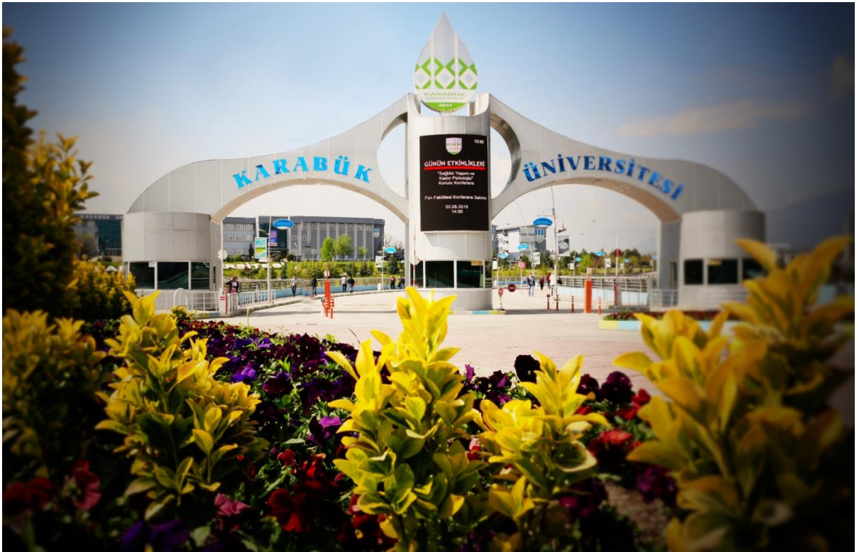
Resim 1 Karabük Üniversitesi Demir Çelik Yerleřkesi

Bir yükseköğretim kurumu olarak üniversitemiz de; 29 Mayıs 2007 tarihli ve 26536 sayılı Resmi Gazetede yayımlanan 5662 sayılı “Yükseköğretim Kurumları Teřkilatı Kanununda ve Yükseköğretim Kurumları Öğretim Elemanlarının Kadroları Hakkında Kanun Hükmünde Kararname İle Genel Kadro ve Usulü Hakkında Kanun Hükmünde Kararnameye Ekli Cetvellerde Değiliřlik Yapılmasına Dair Kanun” ile kurulmuřtur.