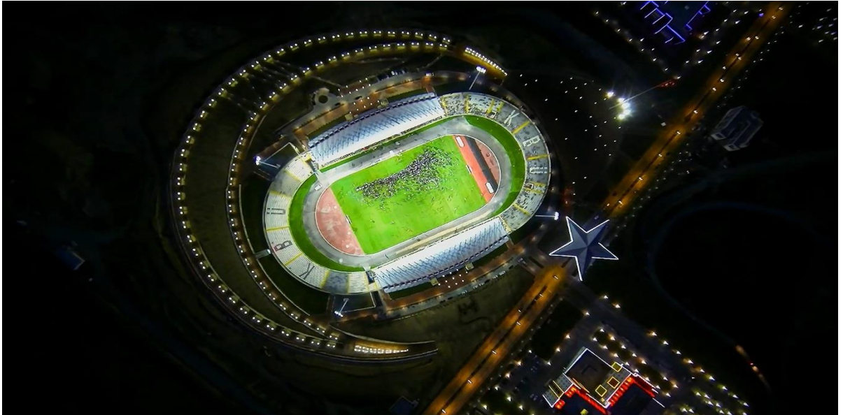
Resim 4 Türkiye'nin İlk ve Tek Ay Yıldızlı Stadyumu

Demir Çelik Yerleşkesinde yer alan ve içerisinde Hasan Doğan Beden Eğitimi ve Spor Yüksekokulu, Orman Fakültesi, Kreş ve Öğrenci Kulüplerini barındıran 25 bin kişi kapasiteli Stadyumun etrafında, ay yıldız şeklinde inşa edilen rekreasyon alanı bulunmaktadır. Bu alan içerisinde 1 adet 5.900 m 2 lik ön meydan, 2 adet 650 m 2 lik yan meydanlar, 1 adet 1.250 m 2 lik yıldız promenadı, 1 adet 28.000 m 2 lik hilal promenadı, 34.500 m 2 lik bitkisel peyzaj alanı yer almaktadır.