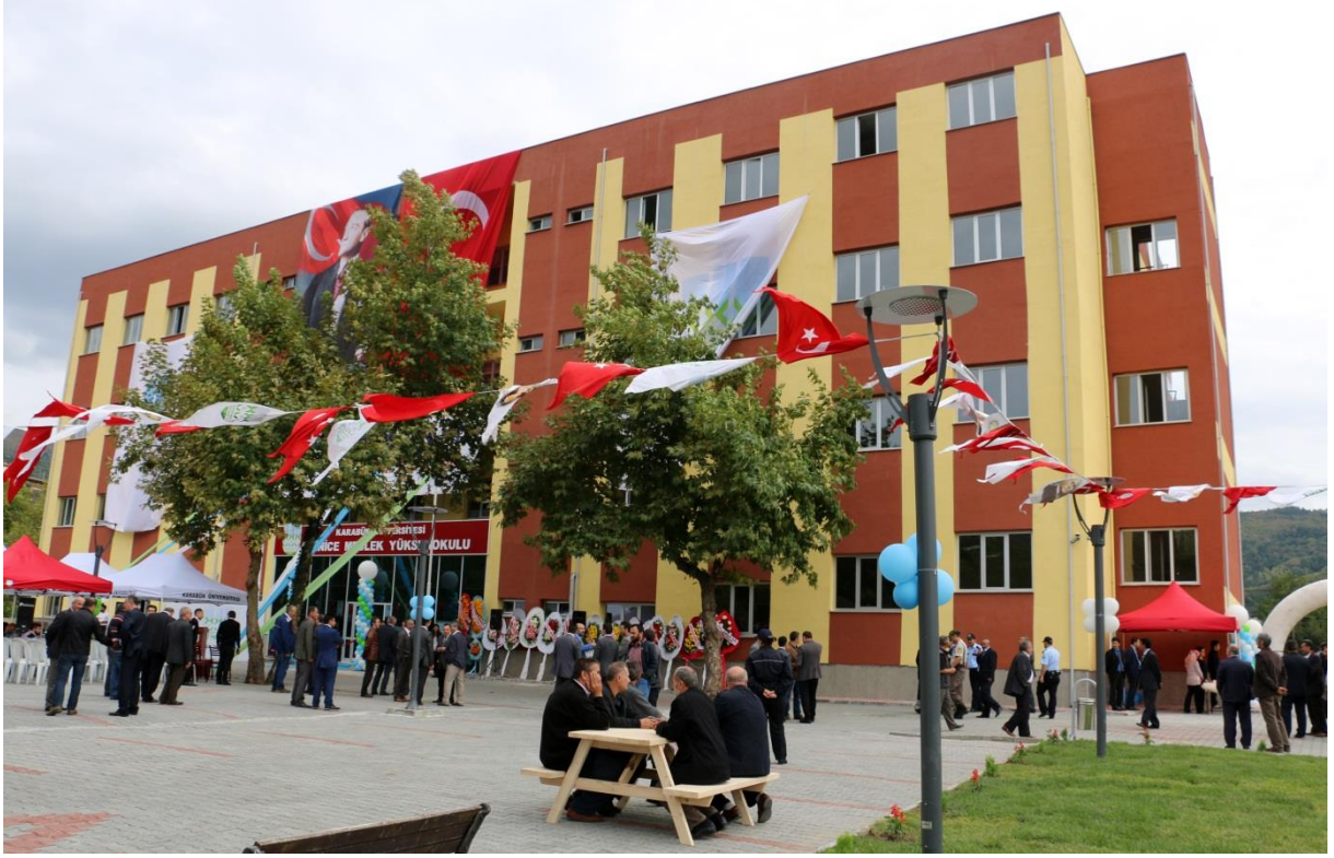
Resim 6 Yenice Meslek Yüksekokulu Binası

Karabük İli, Yenice İlçesinde bulunan yerleşkede 7.396 m 2 açık alan üzerine kurulu, 1.170 m 2 oturma alanına sahip, 4.424 m 2 kapalı alana sahip Yenice Meslek Yüksekokulu binası 2015 yılı içerisinde inşası tamamlanarak hizmete girmiştir.