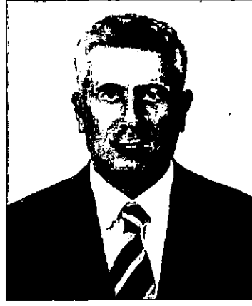
Çınar Belediye Başkanı Mimar Ahmet CENGİZ