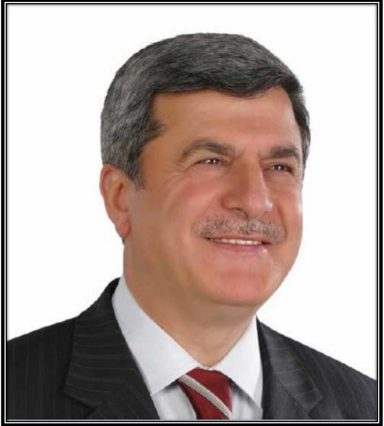
İbrahim KARAOSMANOĞLU Büyükşehir Belediye Başkanı