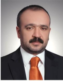
M. Ali KARAASLAN AK PARTİ