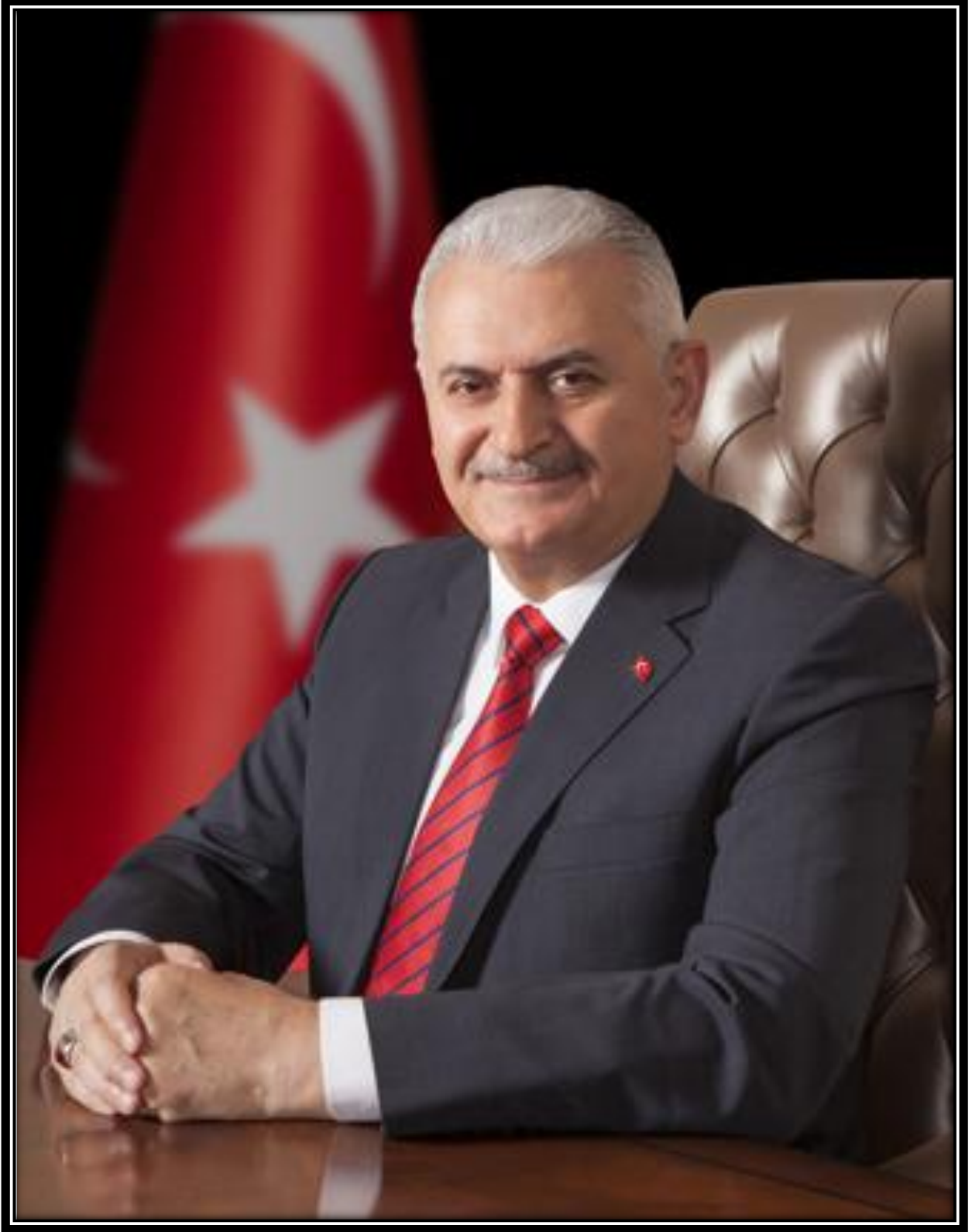
Binali YILDIRIM Başbakan