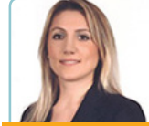
Av. Nilüfer AY