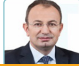
Av. Temel BAŞALAN