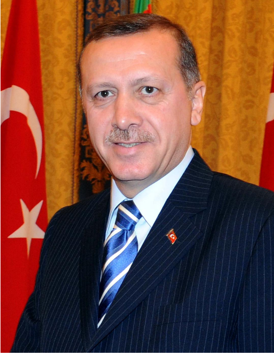
Recep Tayyip ERDOĞAN Başbakan