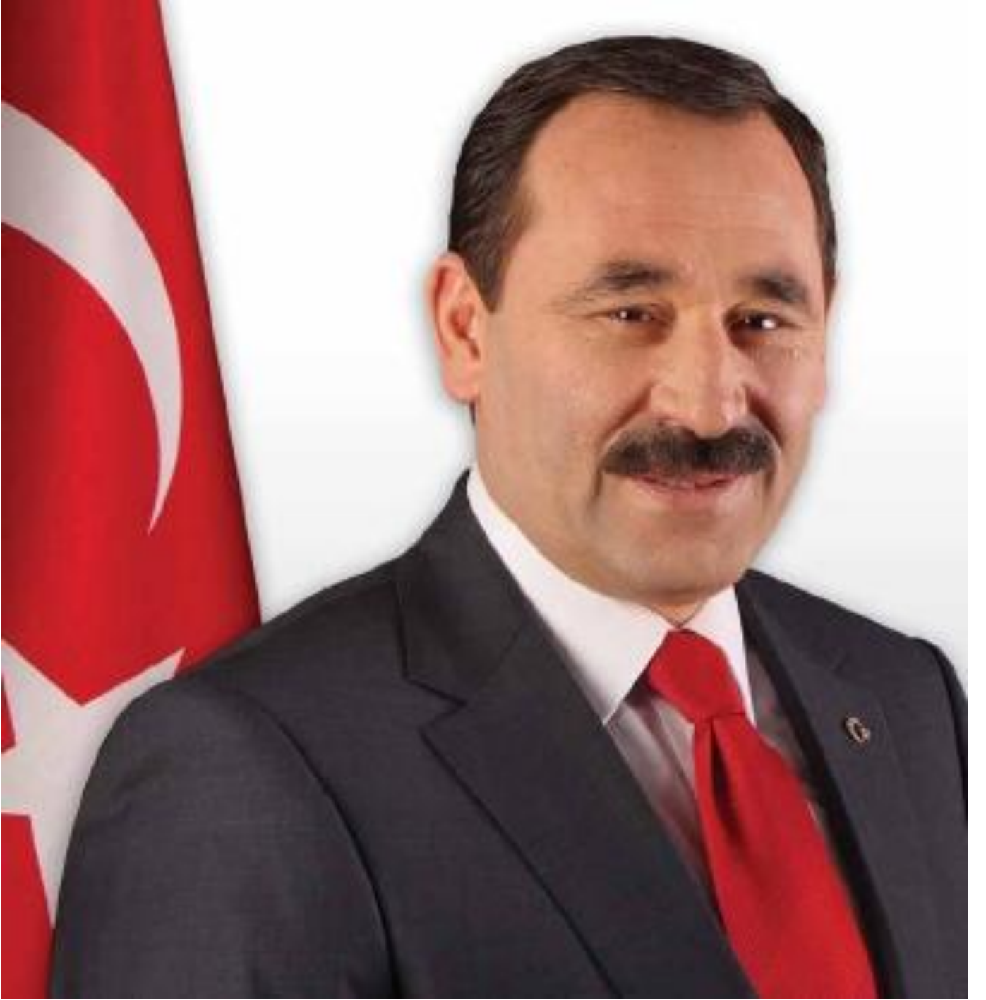
Enver DEMİREL Etimesgut Belediye Başkanı