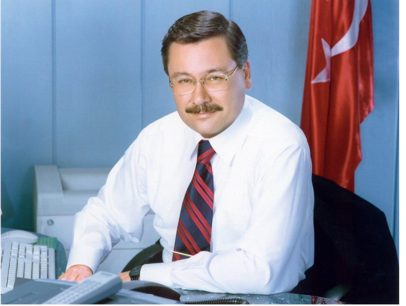
İ. Melih GÖKÇEK Ankara Büyükşehir Belediye Başkanı