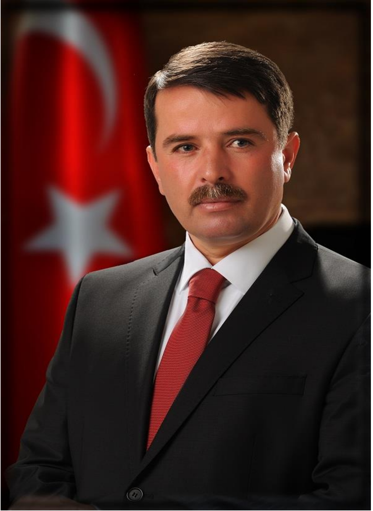
OSMAN OKUMUŞ TÜRKOĞLU BELEDİYE BAŞKANI