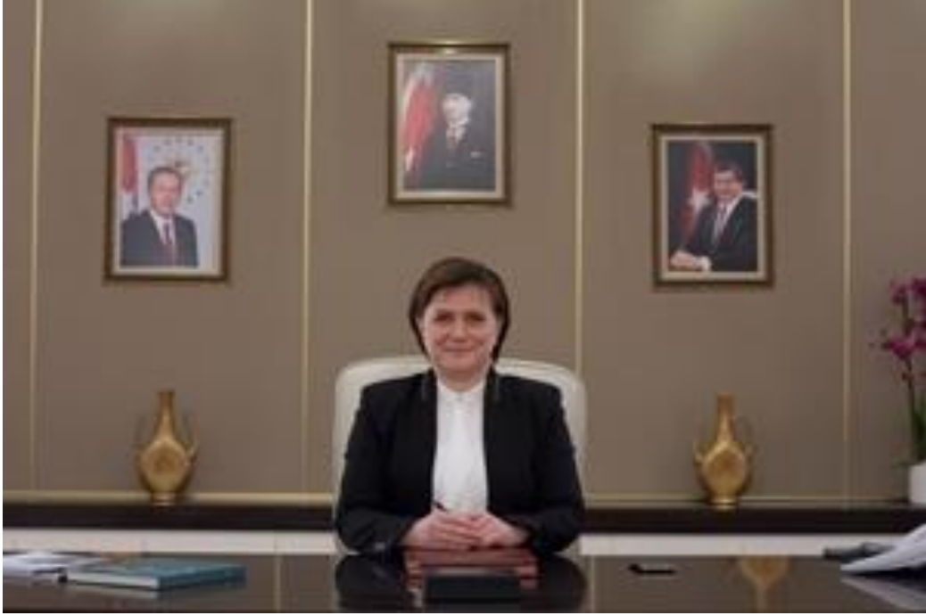
Fatma Güldemet SARI Çevre ve Şehircilik Bakanı