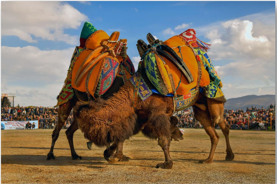
GELENEKSEL DEVE GÜRESLERİ