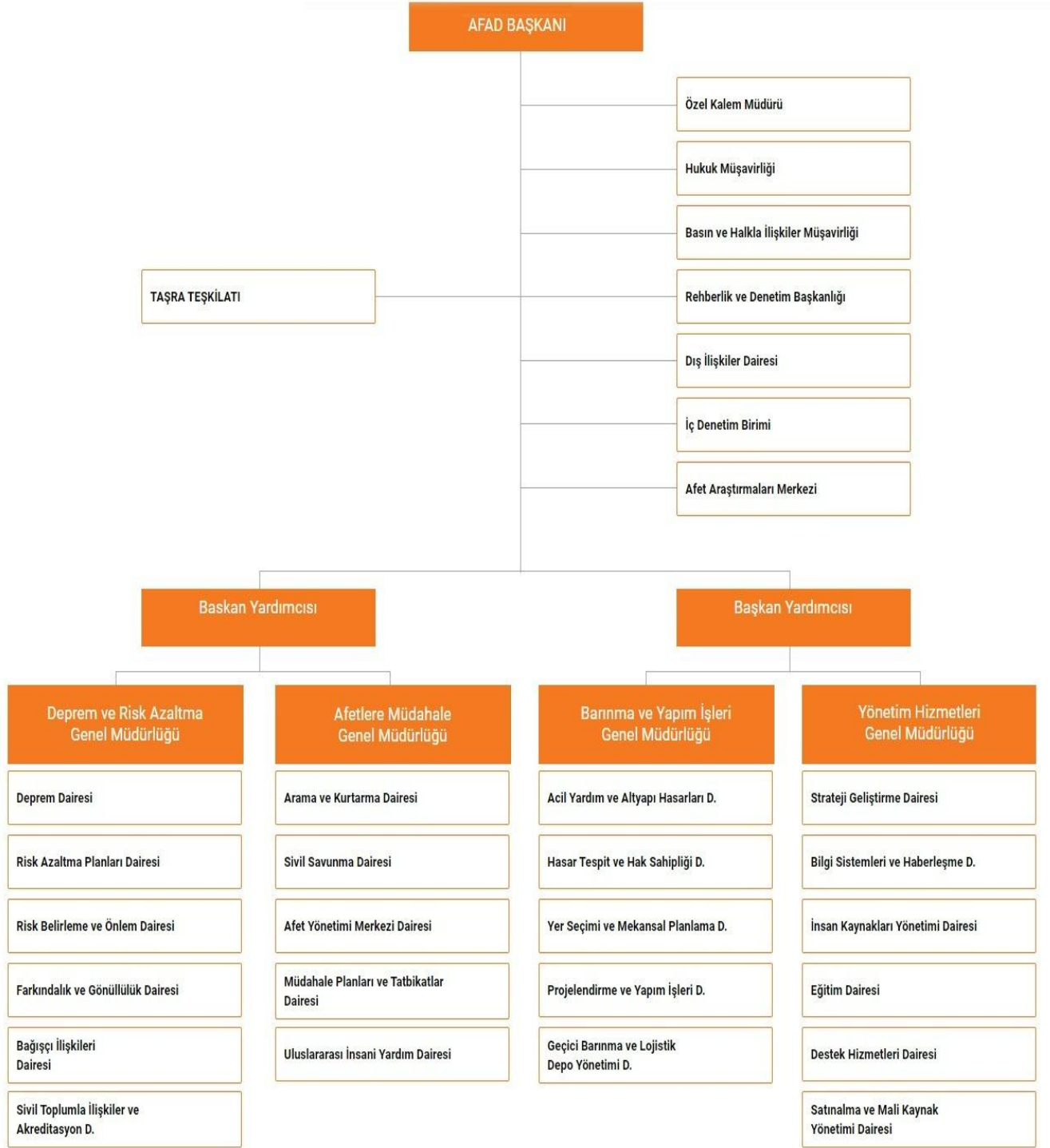
Şekil 1 TEŞKİLAT ŞEMASI