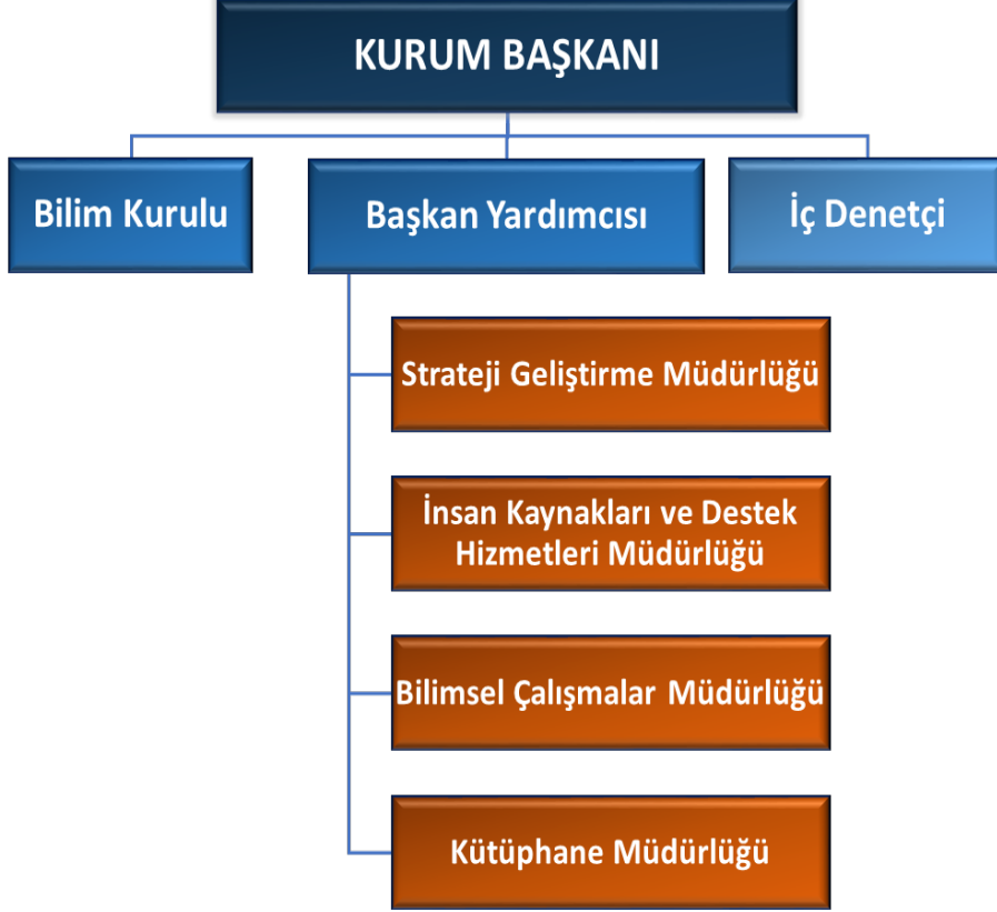
Şekil 1: İdare Teşkilat Şeması.