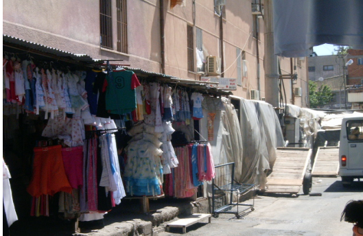
Vakıflar İş Hanı Arkası (Eski Hali)