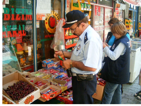
Gıda Satış Yerleri

Gıda üretim ve satış yerleri sürekli denetim altında tutuldu. Özellikle imalat ve son kullanma tarihleri kontrol edilerek son kullanma tarihi geçmiş gıda maddelerine imha edilmek üzere el konularak bu ürünleri satan işyerleri hakkında cezai işlemler yapıldı.