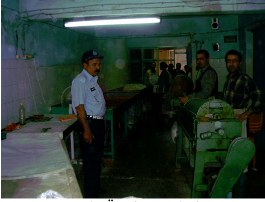
Gıda Üretim Yerleri