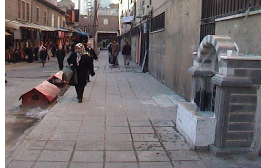
Vakıflar İş Hanı Arkası (Yeni Hali)