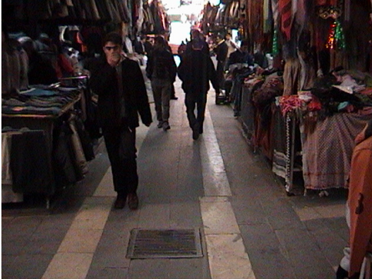
Hazır Elbiseciler Çarşısı