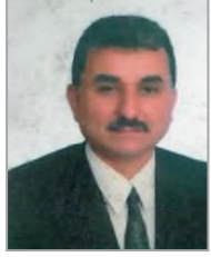
Hüseyin KAHVECİ Adalet ve Kalkınma Partisi