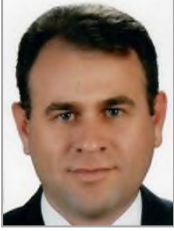
Bekir SELÇUK Adalet ve Kalkınma Partisi