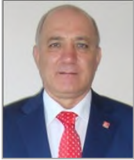
Turgut AYDIN Cumhuriyet Halk Partisi