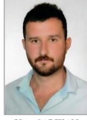
Uğur SARIKAN Adalet ve Kalkınma Partisi