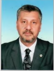
Deniz DİLAVER Cumhuriyet Halk Partisi