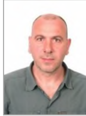
Hürmet KARTAL Cumhuriyet Halk Partisi