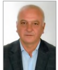
Hüsnü MEYDAN Cumhuriyet Halk Partisi