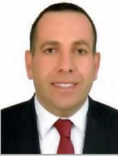
Gökhan ÇÜTELİ Adalet ve Kalkınma Partisi