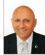
Osman BEKAROĞLU Cumhuriyet Halk Partisi