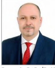
Bünyamin BABAİBAN Adalet ve Kalkınma Partisi