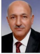
İbrahim CANSIZ Adalet ve Kalkınma Partisi