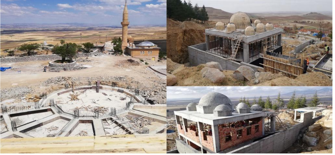
Taptuk Emre Türbesi ile Yunus Emre Türbesi Restorasyon Projeleri

222 adet yapı ruhsatı, 82 adet yapı kullanma izin belgesi düzenlenmiş, 2 adet kaçak ve ruhsata aykırı yer için tutanak işlemi yapılmıştır. 99 adet ifraz, tevhit ve yola terk dosyası kontrol işlemi yapılmıştır. 6 adet hali hazır harita kontrol ve onayı yapılmıştır. 4 köyün imar planı ve imar plan tadilatı onaylanmıştır. 7 köyde toplam 13 adet 18'inci madde uygulaması yapılmıştır. 6 köyde imar planı çalışmaları devam etmektedir.