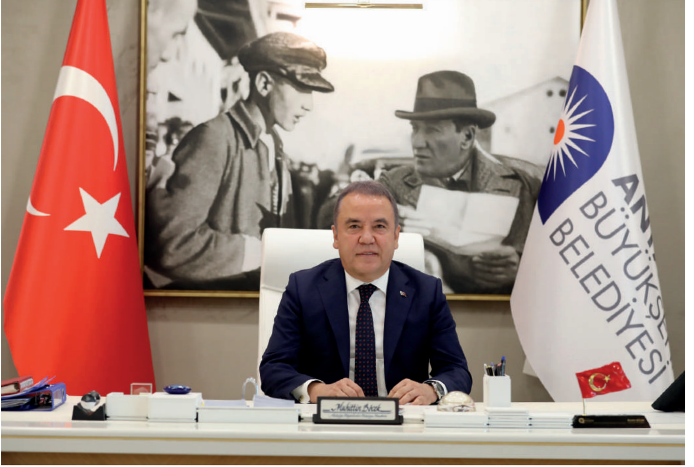
Muhittin BÖCEK Antalya Büyükşehir Belediye Başkanı