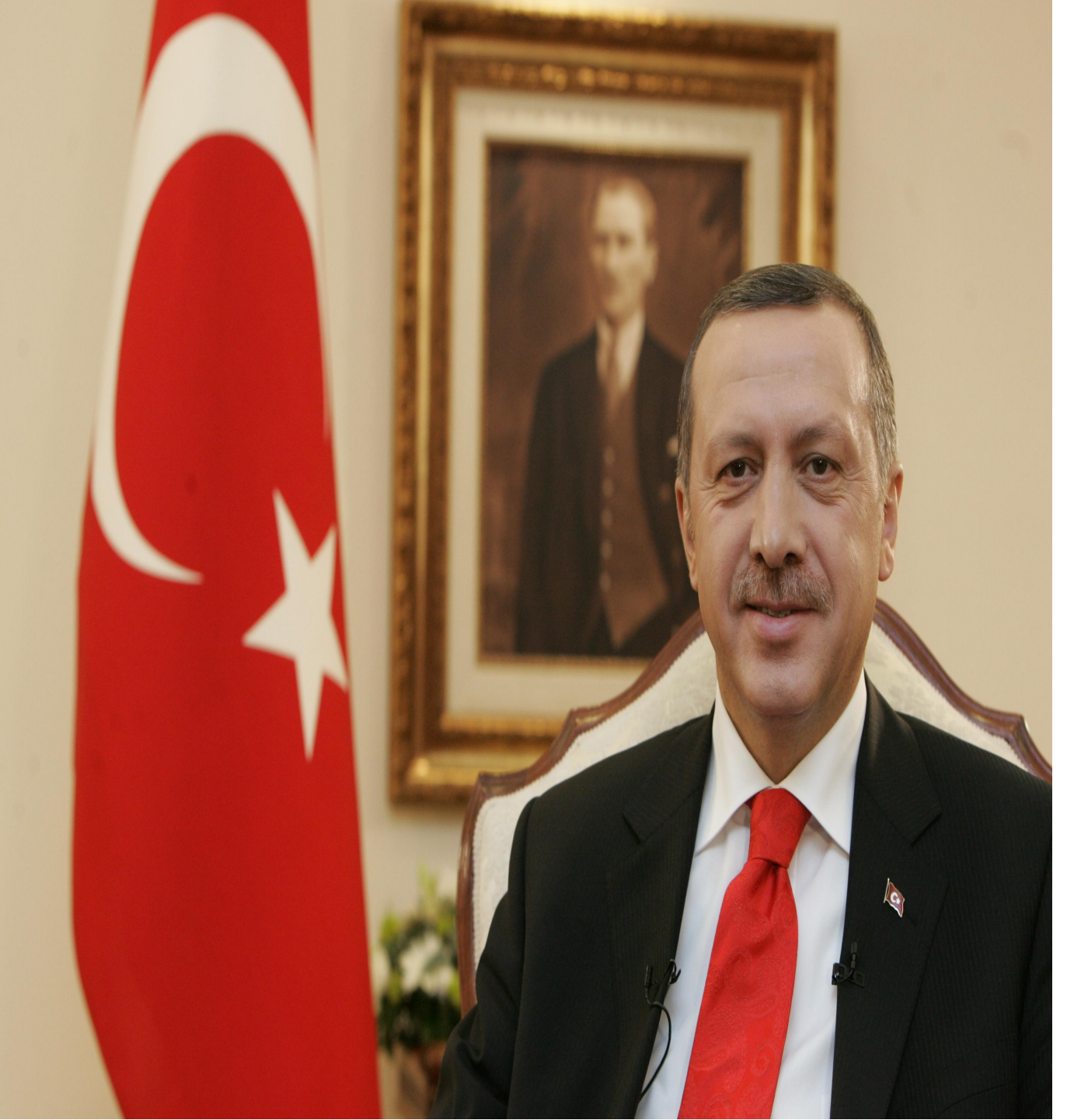
R. TAYYİP ERDOĞAN TÜRKİYE CUMHURİYETİ BAŞBAKANI