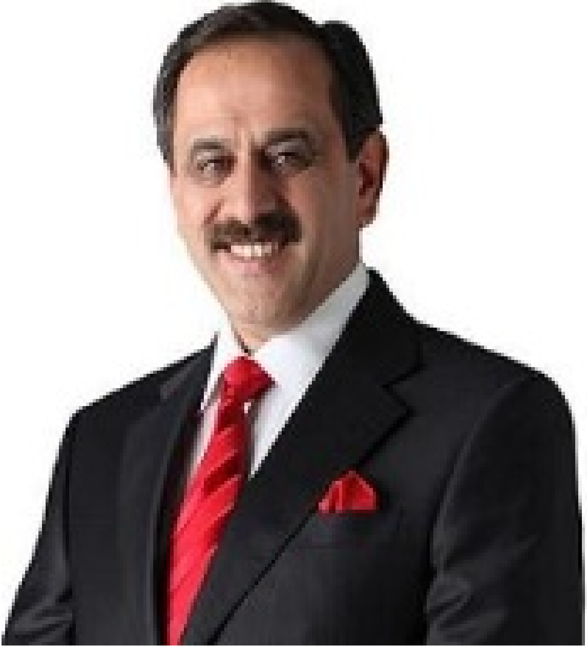
YAŞAR YAZICI SAKARYA İLİ AKYAZI İLÇESİ BELEDİYE BAŞKANI