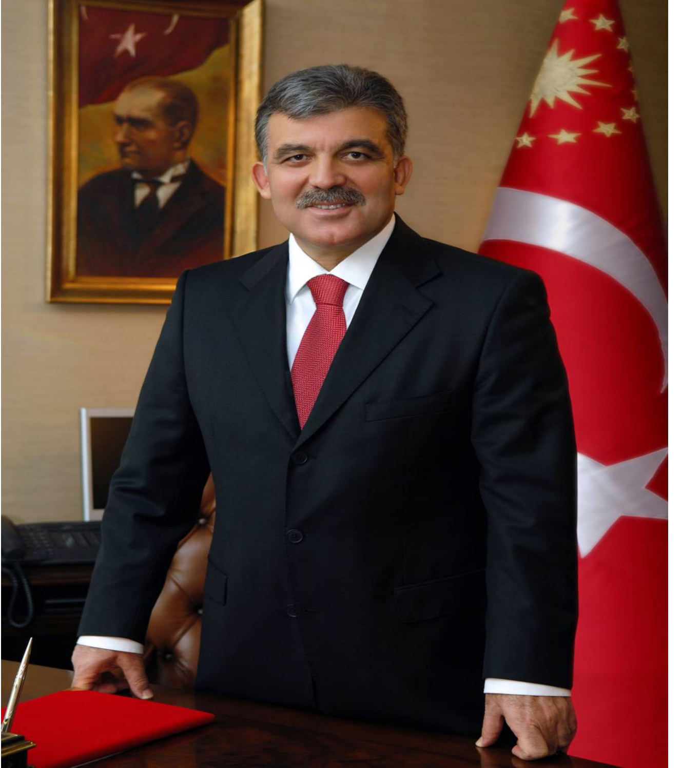
ABDULLAH GÜL TÜRKİYE CUMHURİYETİ CUMHURBAŞKANI