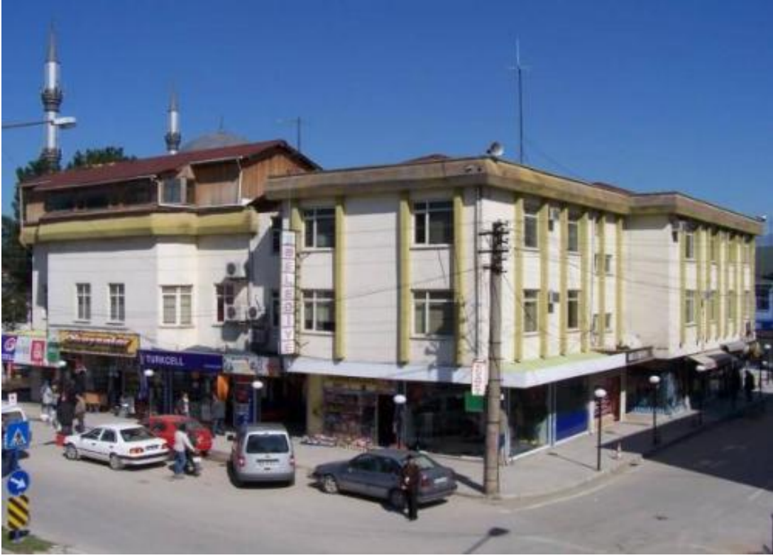
Akyazı Belediyesi Ana Hizmet Binası