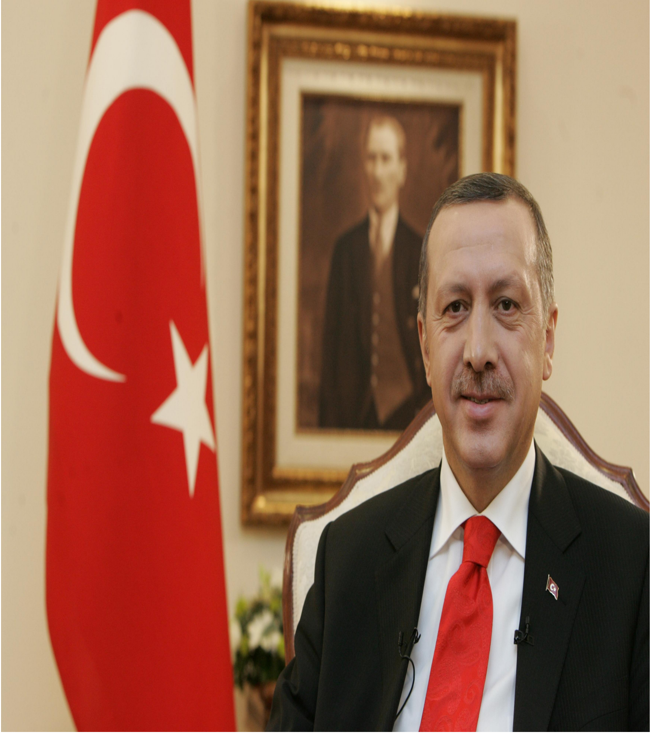
R. TAYYİP ERDOĞAN TÜRKİYE CUMHURİYETİ BAŞBAKANI