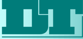
Tablo 3 İDARE PERFORMANS TABLOSU