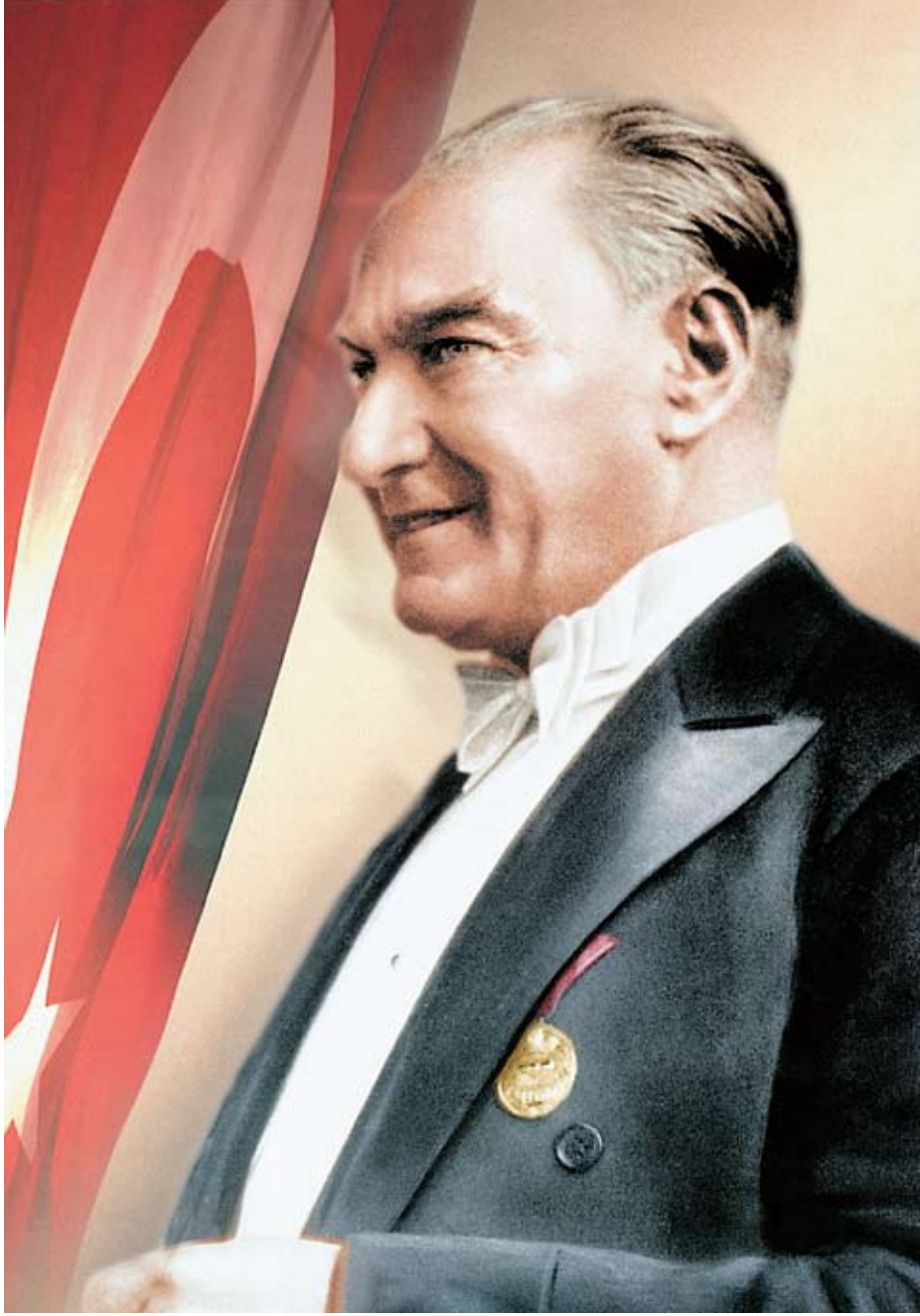
Mustafa Kemal ATATÜRK