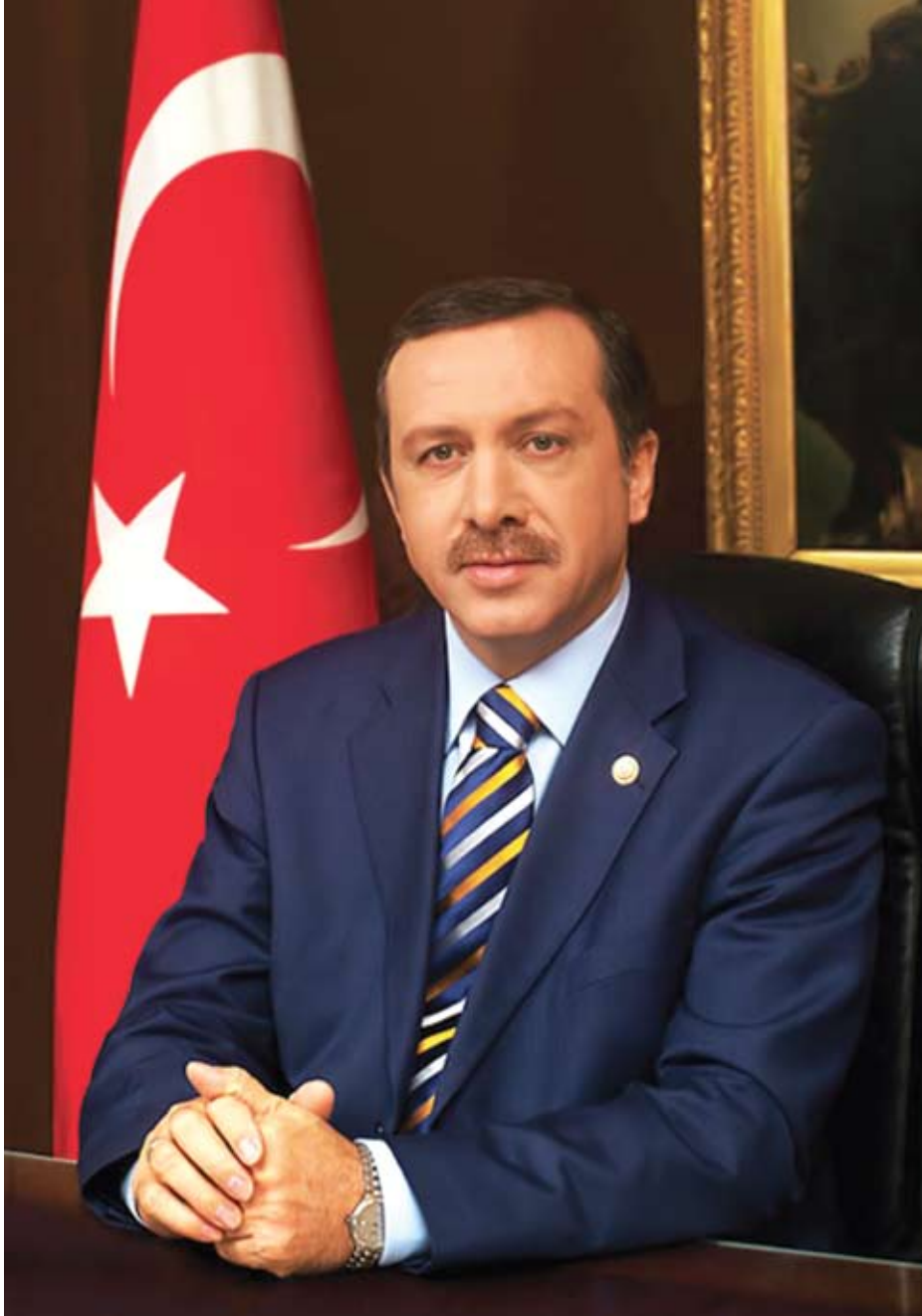
R. Tayyip ERDOĞAN Başbakan