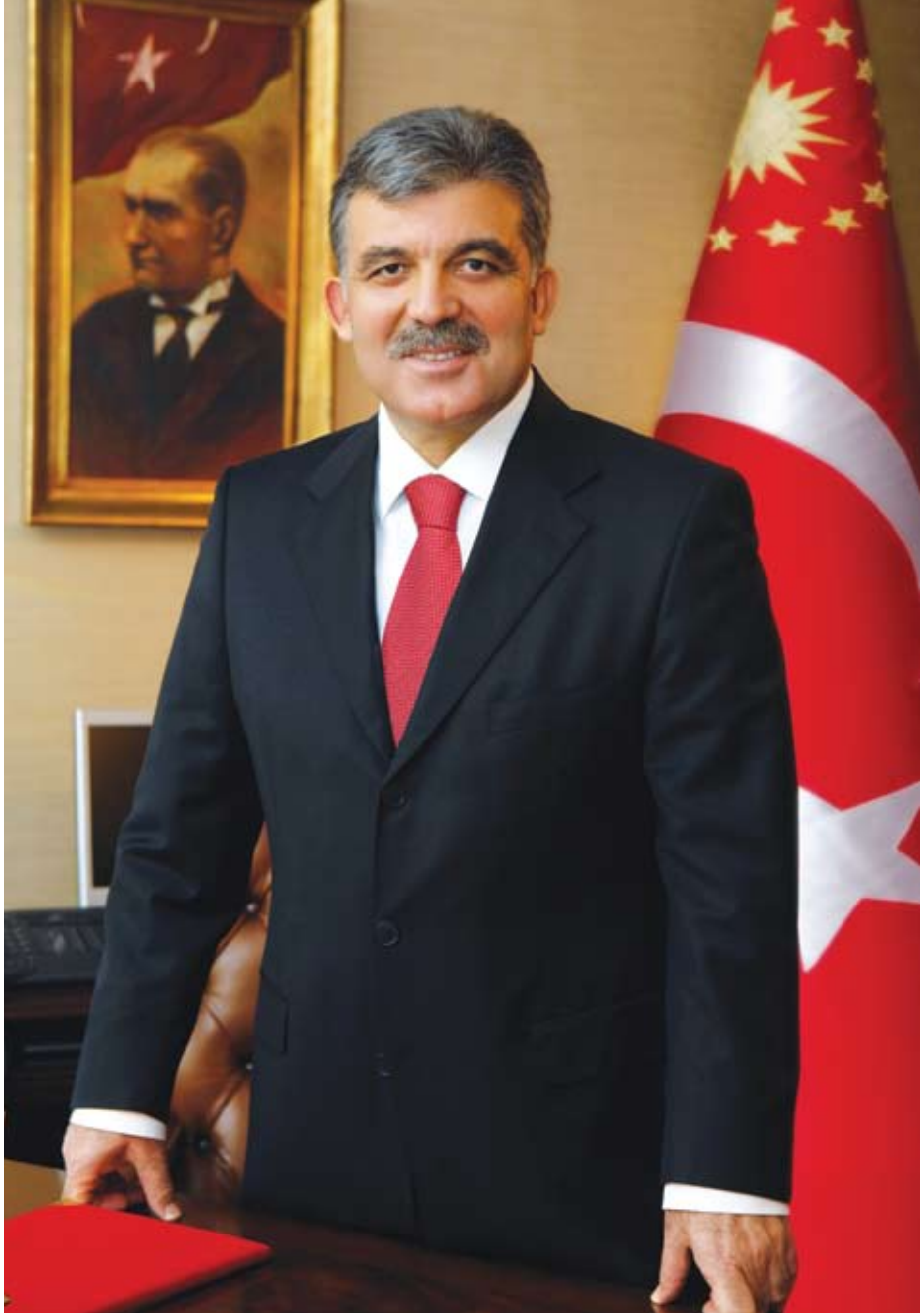
Abdullah GÜL Cumhurbaşkanı