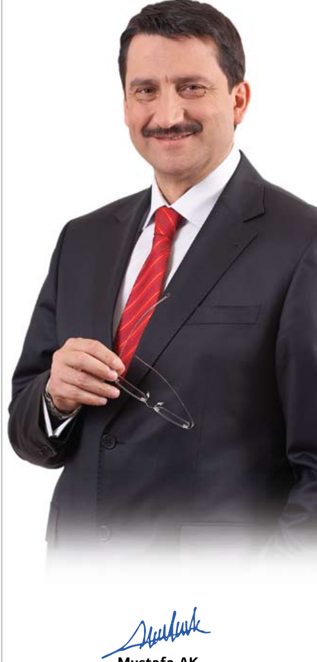
Mustafa AK Belediye Başkanı

Stratejik plan ve performans programının tüm belediyelerimiz için iyi bir yol gösterici olmasını temenni eder, bu programın hazırlanmasında başta emeği geçenler olmak üzere özverili çalışmalarından dolayı Belediyemiz harcama birimi yetkilileri ile diğer emeği geçen çalışma arkadaşlarıma teşekkür ederim.