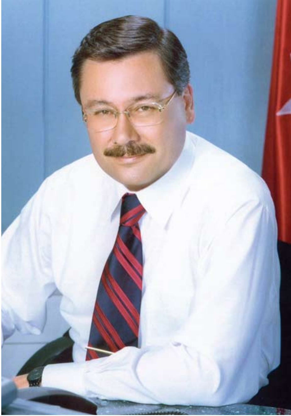
İ. Melih GÖKÇEK Ankara Büyükşehir Belediye Başkanı