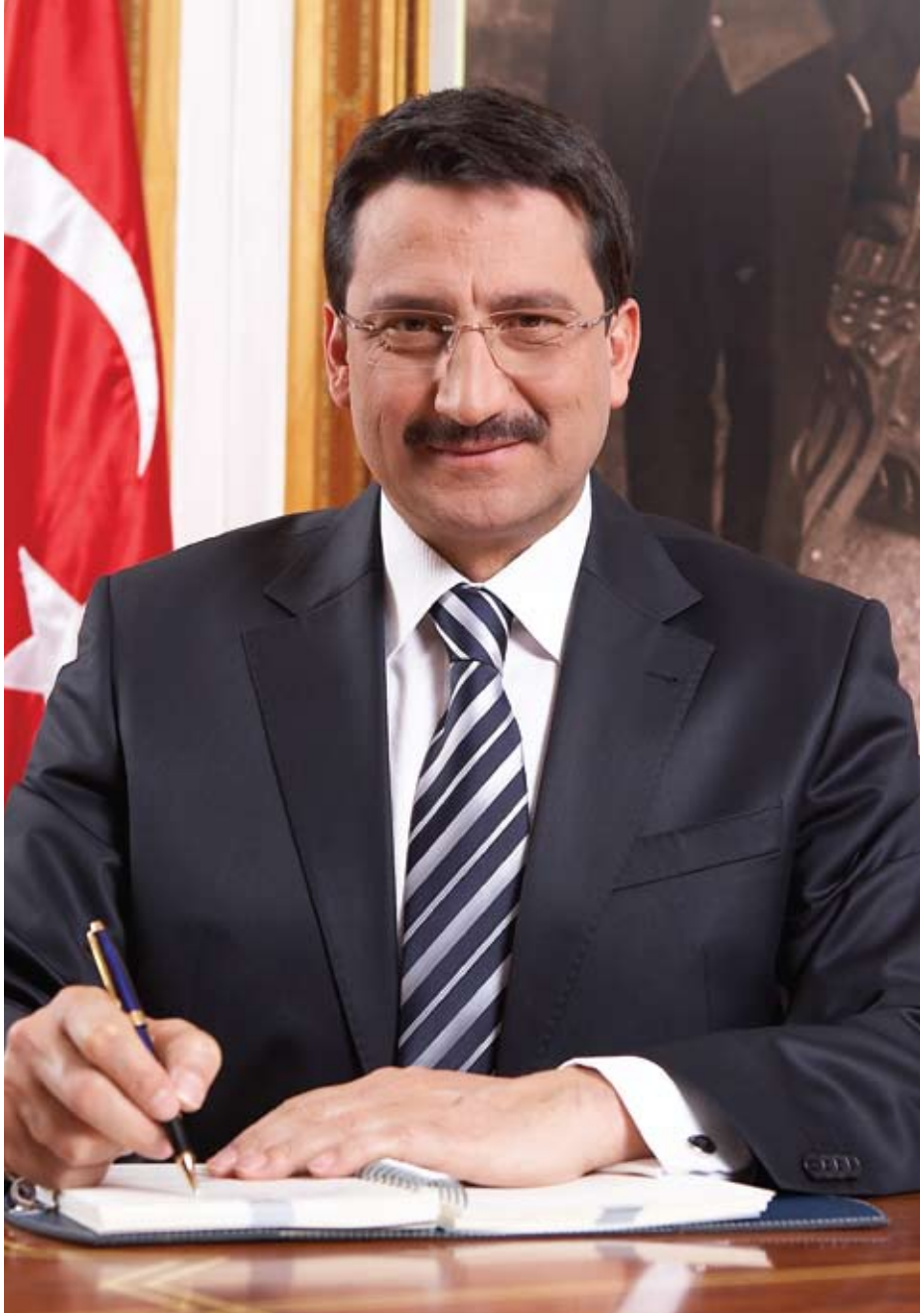
Mustafa AK Keçiören Belediye Başkanı