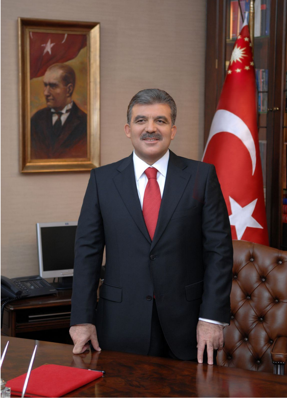
Abdullah GÜL Cumhurbaşkanı