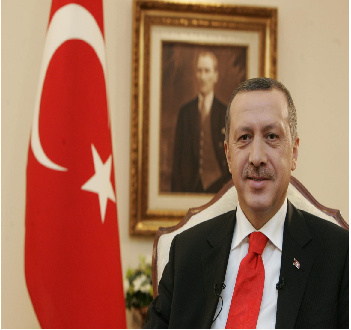
Recep Tayyip ERDOĞAN BAŞBAKAN