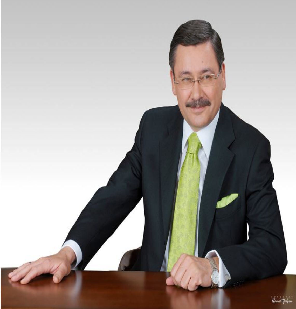
İ. Melih GÖKÇEK ANKARA BÜYÜKŞEHİR BELEDİYE BAŞKANI