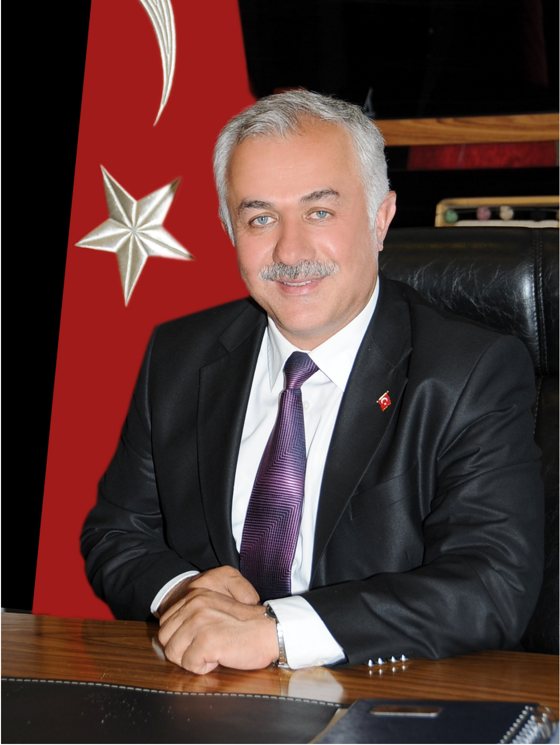
Lokman ÖZDEN Çubuk Belediye Başkanı