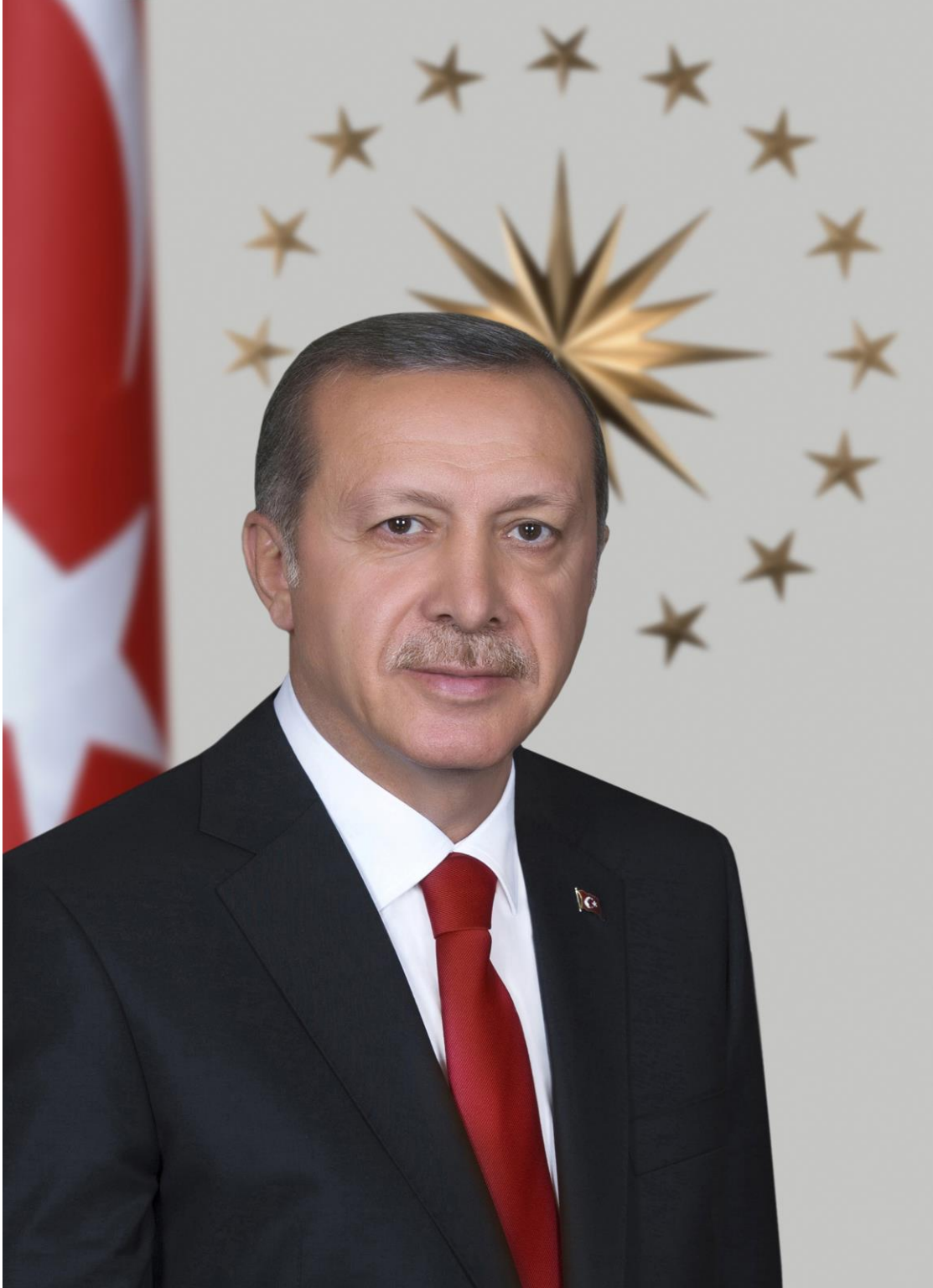
Cumhurbaşkanı Recep Tayyip ERDOŐAN