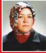
Hatice Çakmak AK PARTİ