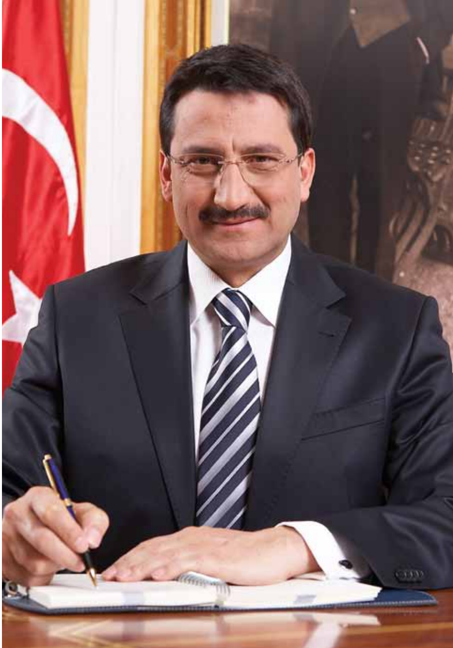
Mustafa AK Keçiören Belediye Başkanı