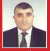
Fidayet Özkan MHP