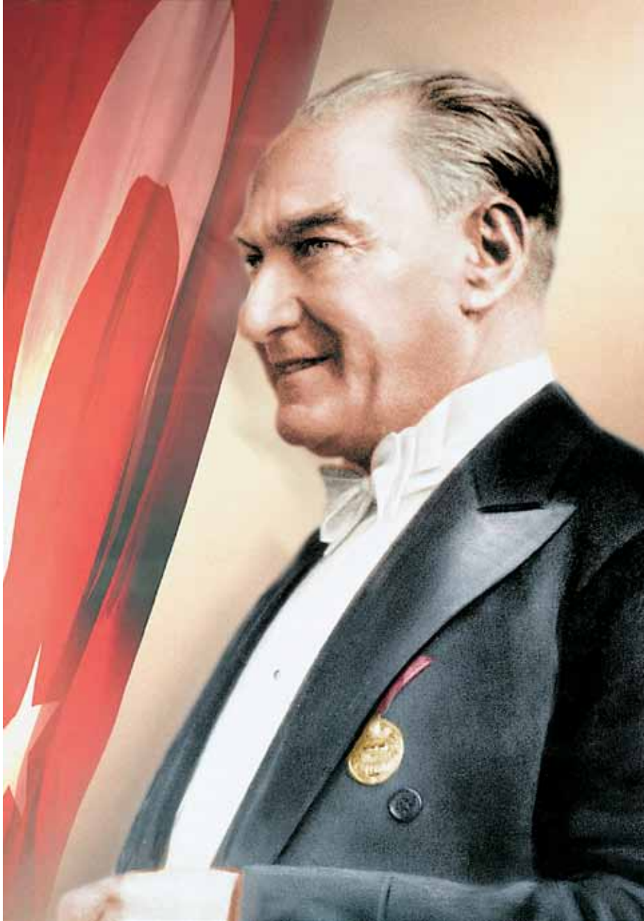
Mustafa Kemal ATATÜRK