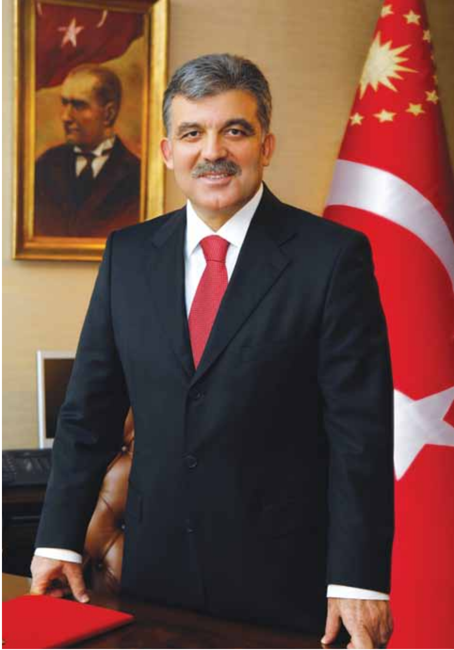
Abdullah GÜL Cumhurbaşkanı