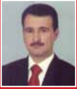
Bülent Yağmur AK PARTİ