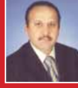
Durmuş Akbaş MHP