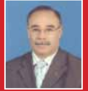
Mesut Gürener MHP