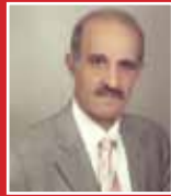
Mücahit Yıldırım AK PARTİ