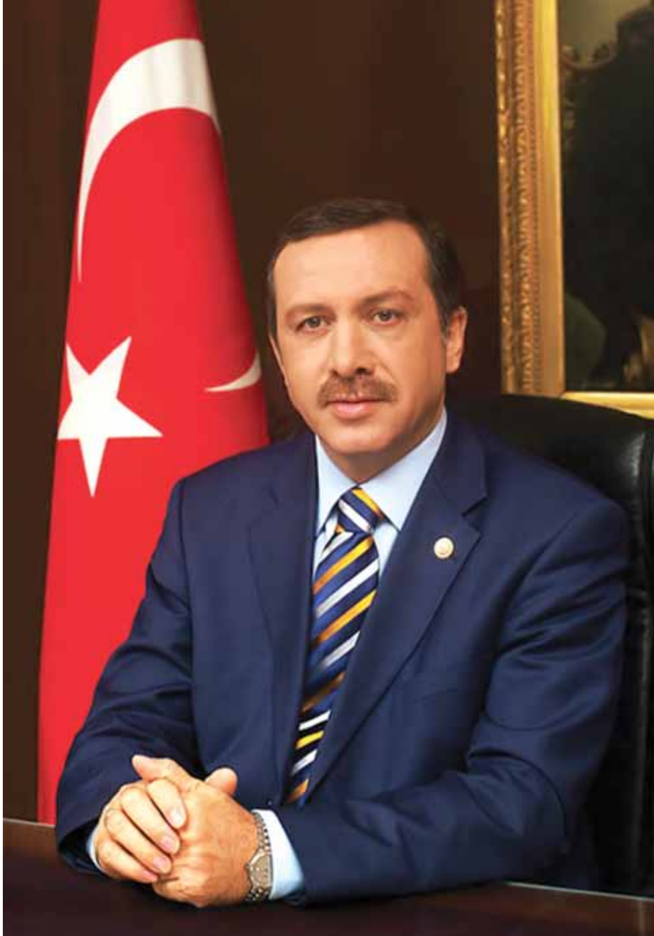
R. Tayyip ERDOĞAN Başbakan