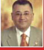
Ahmet Kıymaz MHP