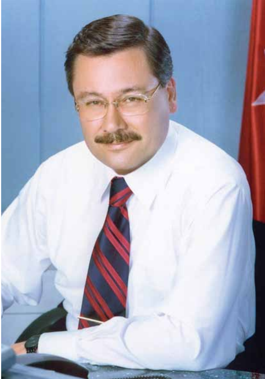
İ. Melih GÖKÇEK Ankara Büyükşehir Belediye Başkanı