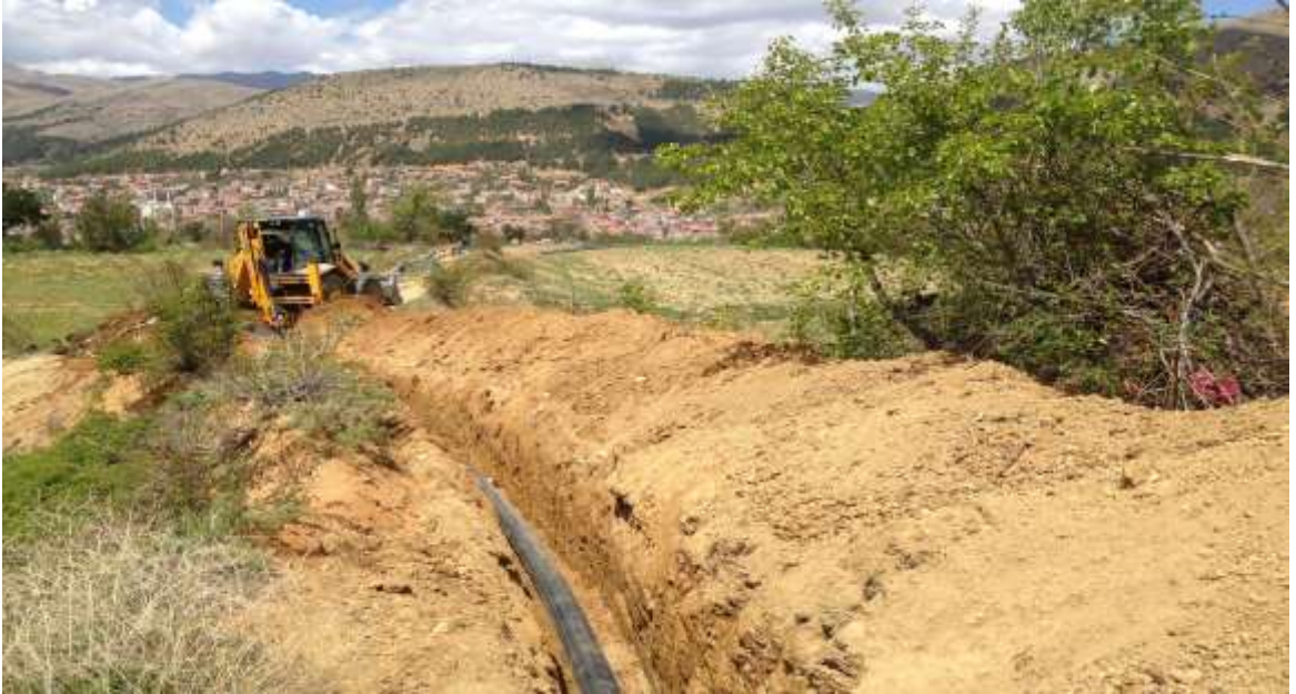
Çelikhan İlçesi Mutlu Köyü Sulama Tesisi