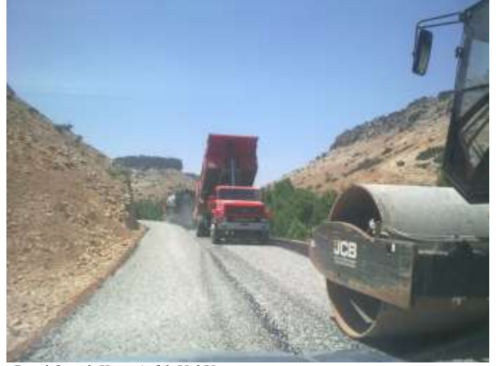
Besni Oyratlı Köyü Asfalt Yol Yapımı