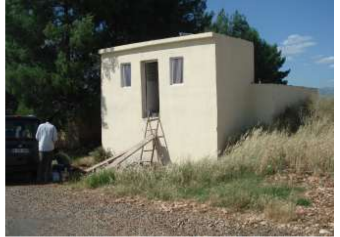
Merkez Börgenek İçme Suyu Tesisi Yapımı