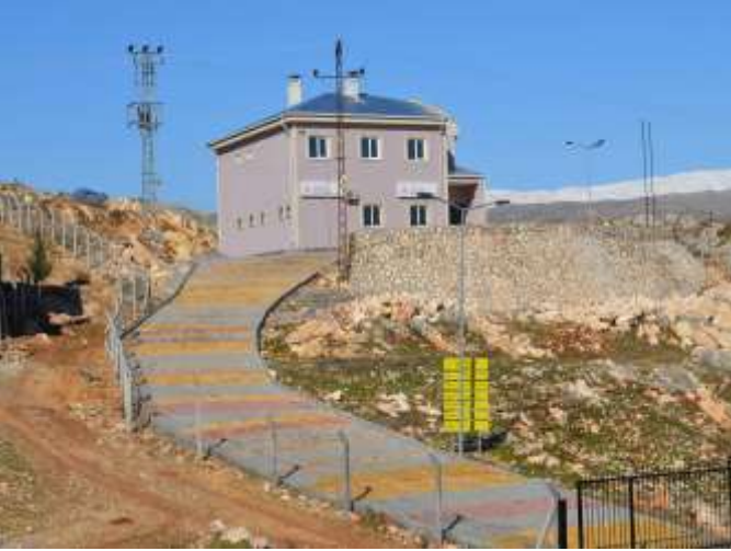
Besni İlçesi Atmalı Köyü 112 Acil Sağlık İstasyonu