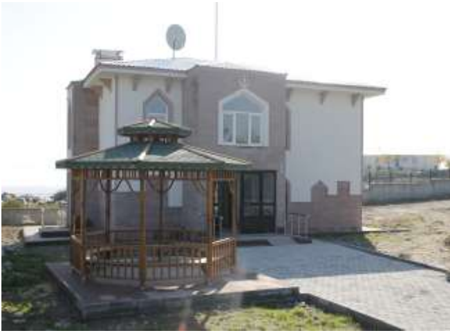
Merkez Kuştepe Sağlık Evi