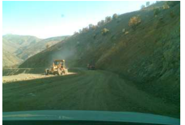
Sincik Arıkonak Köyü Yol Genişletme Çalışması