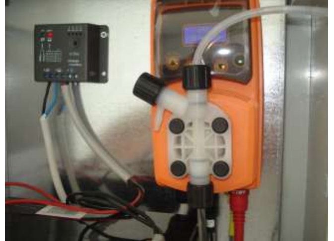
Merkez Büklüm Köyü Mürsel Mezrası İçme Suyu Tesisi Yapımı