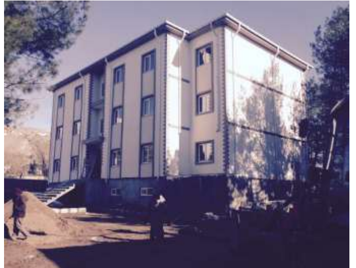
Gerger Aile Sağlık Merkezi