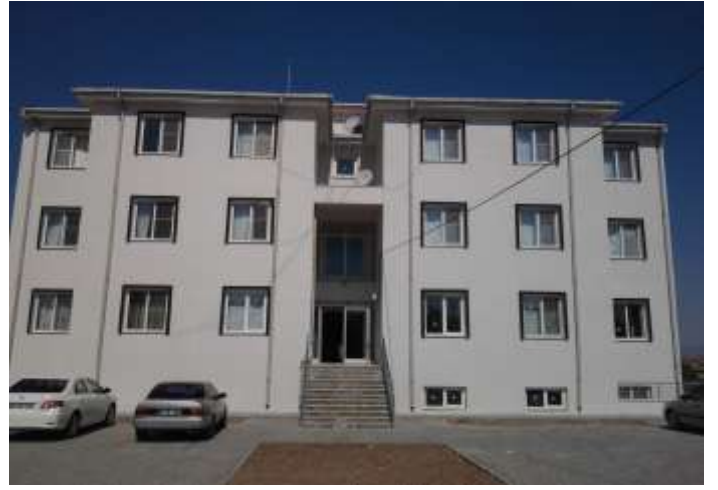
Samsat Devlet Hastanesi 6 Daireli Lojmanı