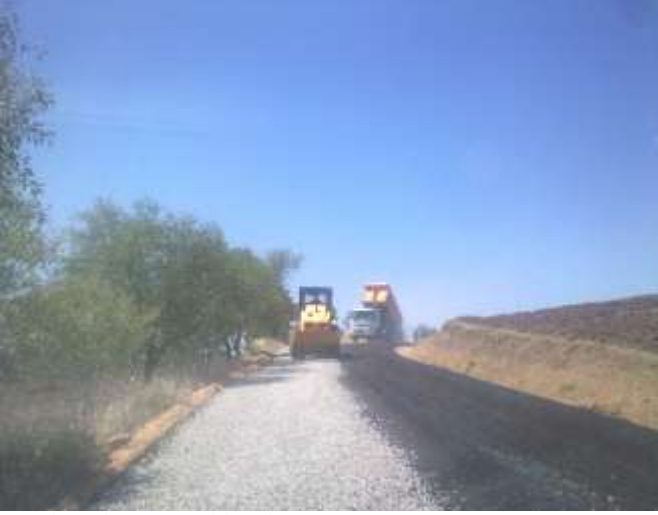
Besni Karalar Köyü Asfalt Yol Yapımı