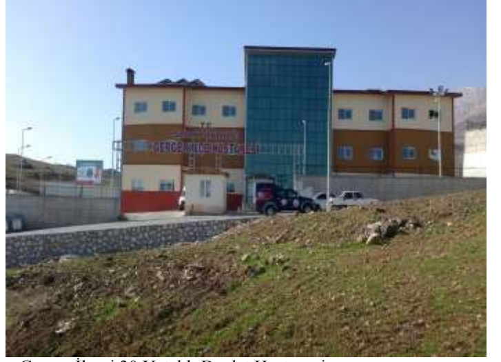
Gerger İlçesi 30 Yataklı Devlet Hastanesi