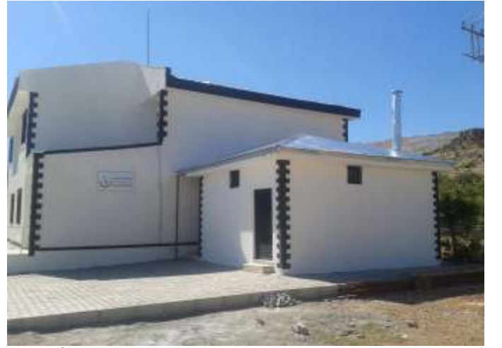
Gerger İlçesi Güngörmüş Köyü Aile Sağlık Merkezi