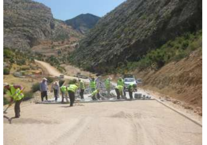
Nemrut Dağı Kral Yolu Kilitli Parke Taşı Çalışması