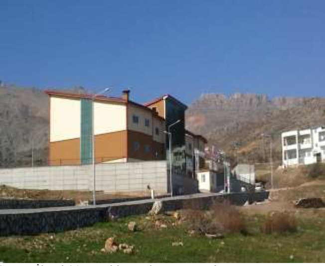
Gerger İlçesi 30 Yataklı Devlet Hastanesi