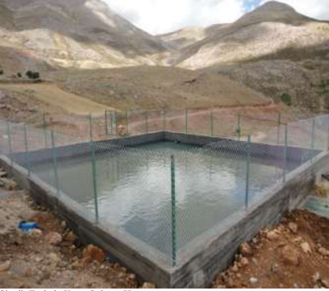
Sincik Taşkale Köyü Sulama Havuzu