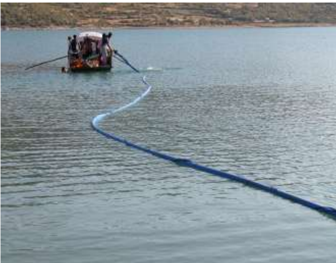
Kağındak Köyü İçme Suyu Tesisi Yapımı