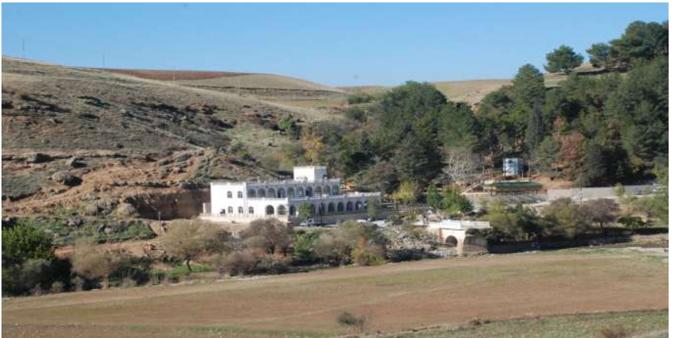
Adiyaman Beşpinar Vadisi Kırık Köprüsü Sosyal Tesisleri Dinlenme ve Rekreatyon Alanı