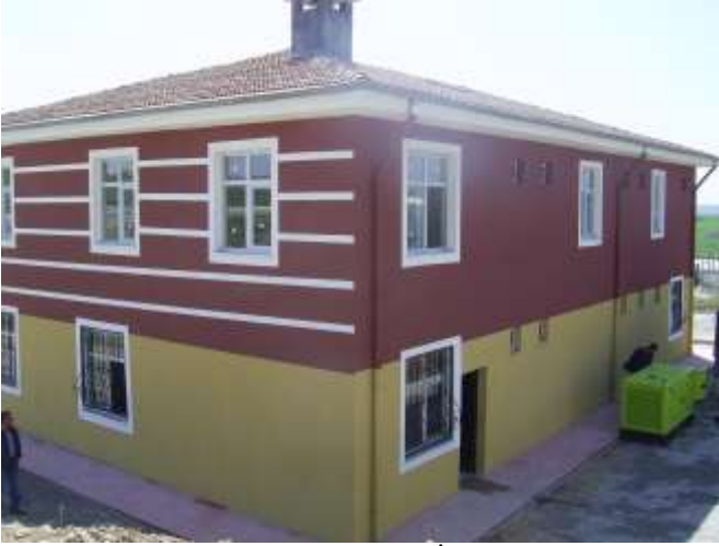
Merkez Hasancık 112 Acil Sağlık İstasyonu