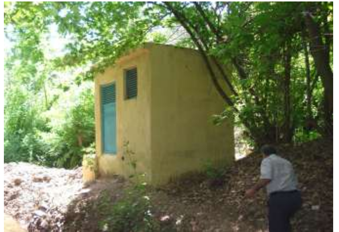
Ekinci Koşin İçme Suyu Tesisi Yapımı