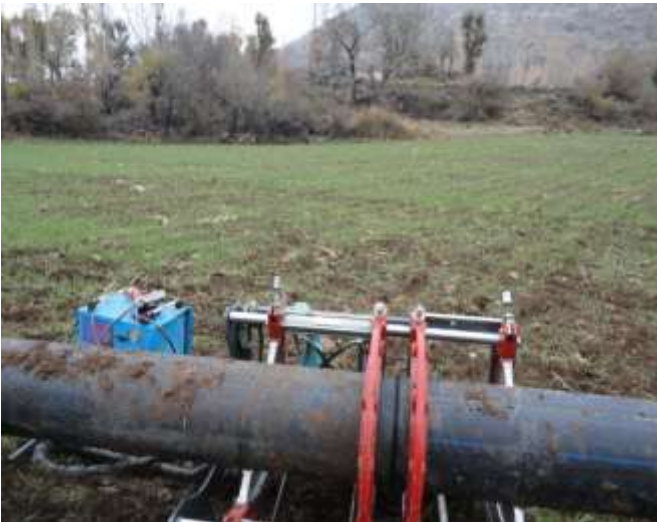
Merkez Yaylakonak Sulama Tesisi