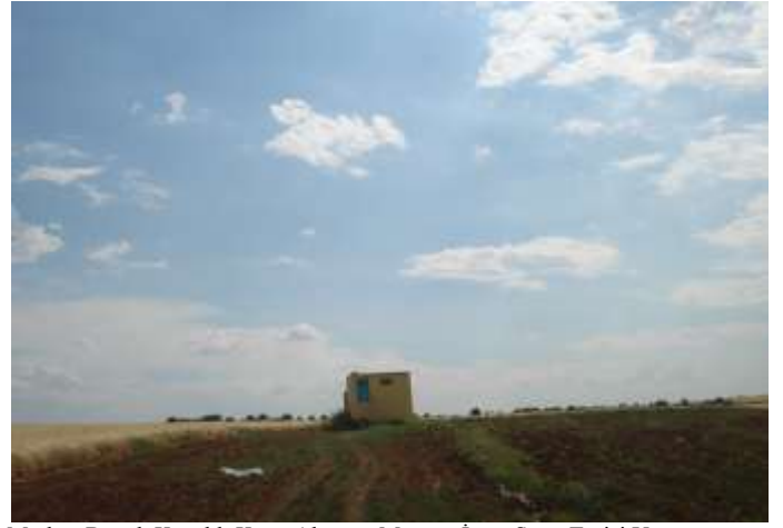
Merkez Büyük Kavaklı Köyü Altıntop Mezrası İçme Suyu Tesisi Yapımı