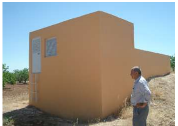
Kâhta İlçesi Ovacık Köyü İçme Suyu Tesisi Yapımı