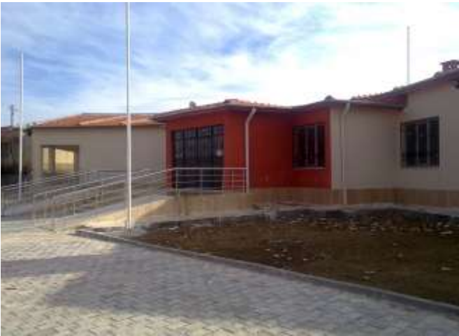
Atakent Aile Sağlık Merkezi