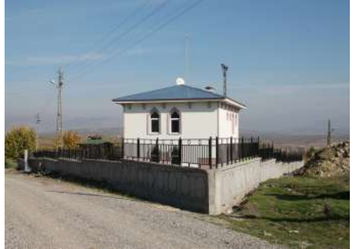
Merkez Kuştepe Sağlık Evi