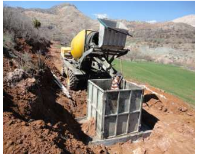
Merkez Yaylakonak Sulama Tesisi