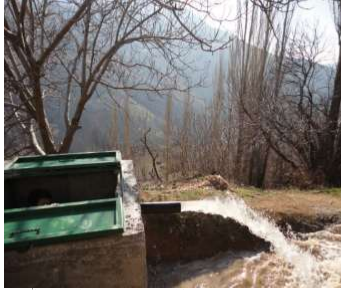
Sincik İlçesi Pınarbaşı Köyü Sulama Tesisi