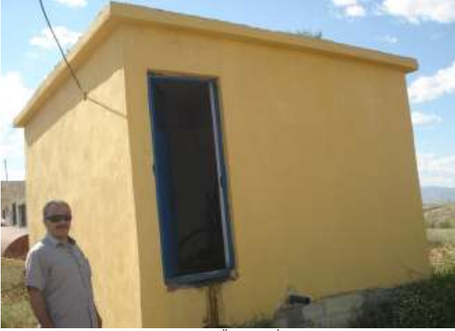
Merkez Kuyucak Çiçek ve Gazihan Üniteleri İçme Suyu Tesisi Yapımı