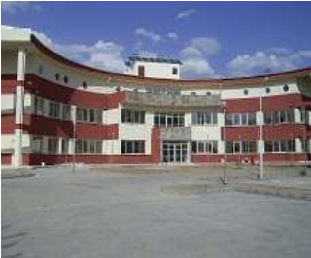
Kâhta Toplu Sağlık Merkezi