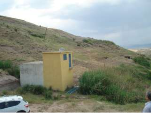
Merkez Büyük Tecir ve Çiçek Üniteleri İçme Suyu Tesisi Yapımı