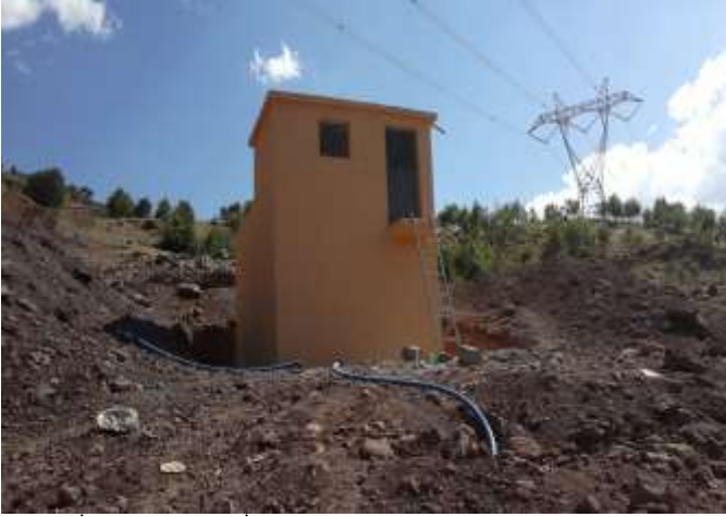
Gerger İlçesi Tillo Köyü İçme Suyu Tesisi Yapımı