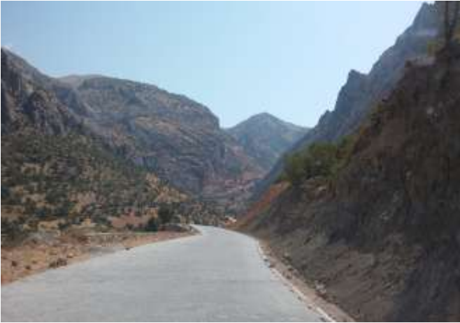
Nemrut Dağı Yolu Yol Yapımı