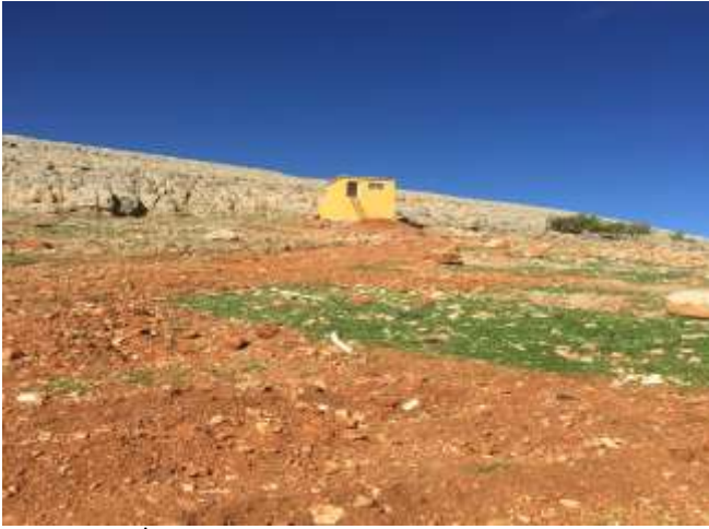
Köklüce Köyü İçme Suyu Tesisi Yapımı