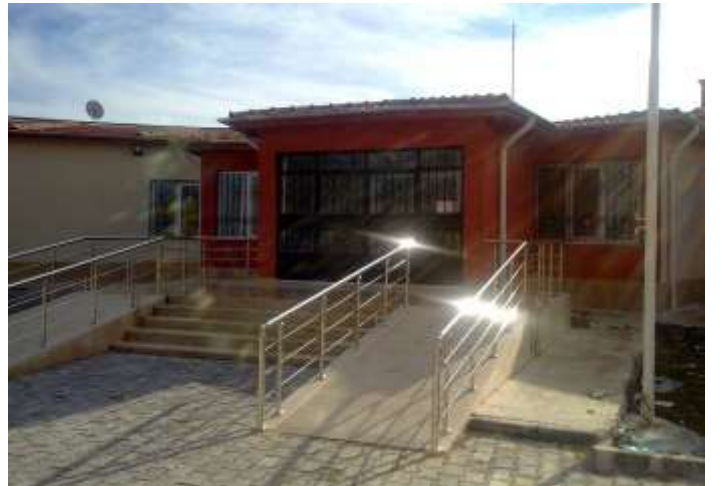
Atakent Aile Sağlık Merkezi