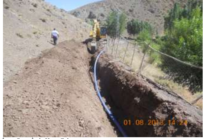
İçme Suyu İsale Hattı Çalışması