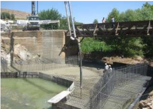
Girik Köprüsü Yapımı İnşaat Çalışması