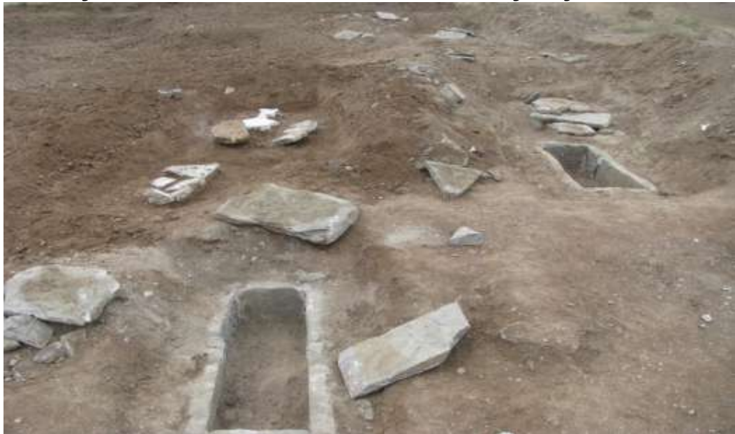
Kızılırmak ilçesi kazı alanı