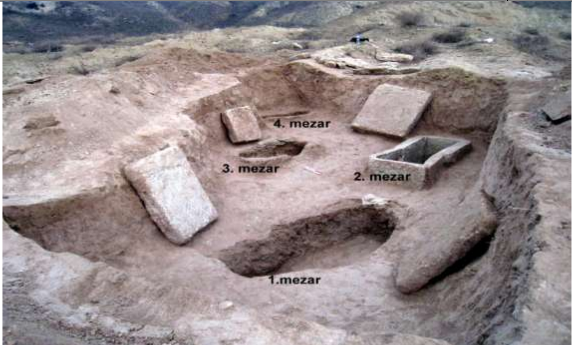
Çankırı Merkez Karataş Mah. Sondaj Kazısı