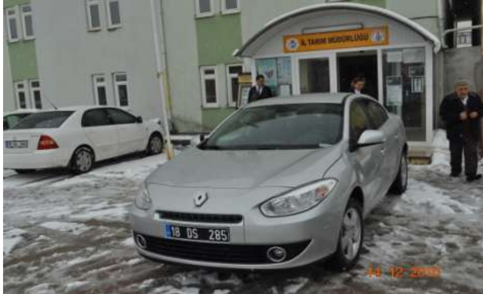
TARIM HİZMETLERİ İÇİN 2010 YILINDA YAPILAN HARCAMALAR

İlimizde gıda denetimlerinin ve diğer hizmetlerin daha sağlıklı bir şekilde yapılabilmesi için İl Müdürlüğümüze bir adet hizmet aracı ve Kontrol Şubesinde kullanılmak üzere donanımlı bir adet minibüs alımı yapılmıştır.