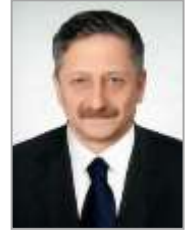
Şendoğan KARATAŞ Adalet ve Kalkınma Partisi