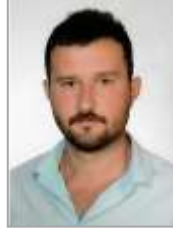
Uğur SARIKAN Adalet ve Kalkınma Partisi