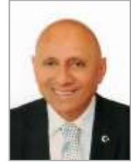
Osman BEKAROĞLU Cumhuriyet Halk Partisi