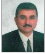
Hüseyin KAHVECİ Adalet ve Kalkınma Partisi