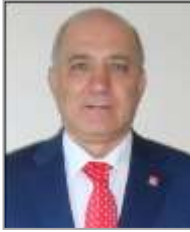
Turgut AYDIN Cumhuriyet Halk Partisi