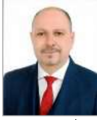
Bünyamin BABAİBAN Adalet ve Kalkınma Partisi