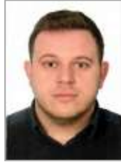
Samet AYVAZ Adalet ve Kalkınma Partisi