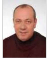
Lütfi ÇAVUŞ Adalet ve Kalkınma Partisi