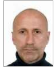
Hasan ŞENOL Cumhuriyet Halk Partisi