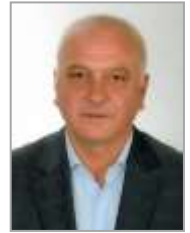
Hüsnü MEYDAN Cumhuriyet Halk Partisi