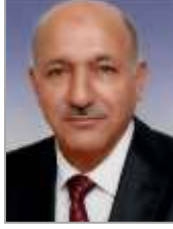
İbrahim CANSIZ Adalet ve Kalkınma Partisi