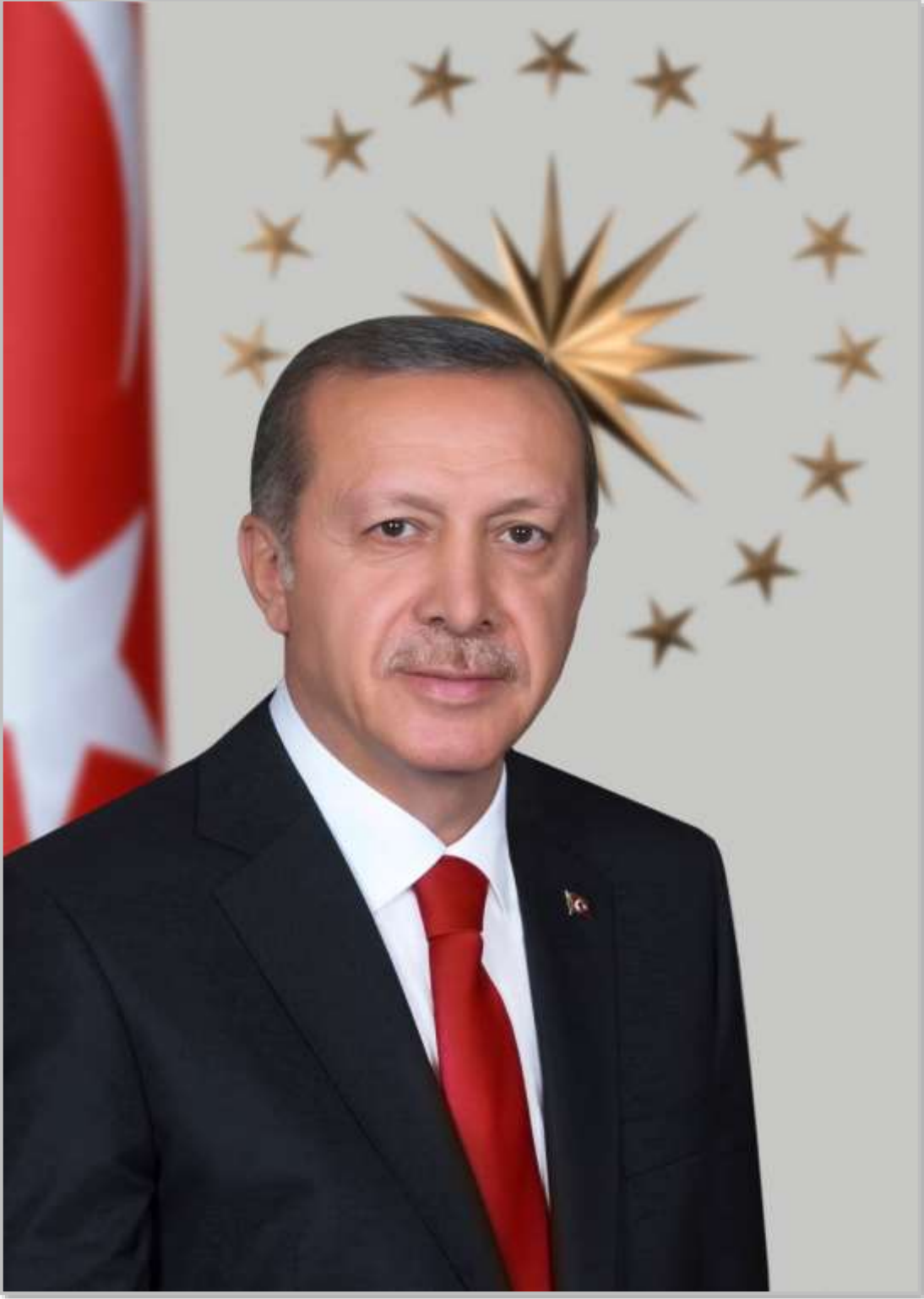
Cumhurbaşkanımız Recep Tayyip ERDOĞAN