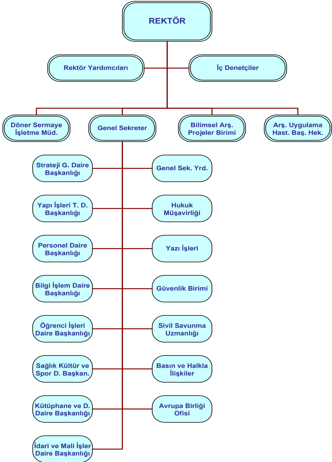
Şekil 2: İdari Organizasyon Şeması