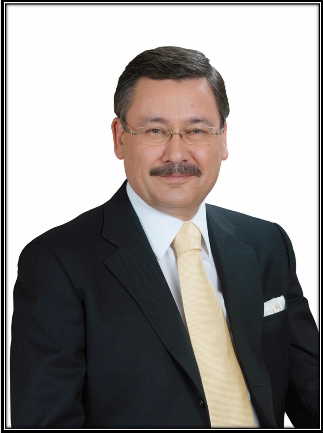
İ. Melih GÖKÇEK Büyükşehir Belediye Başkanı