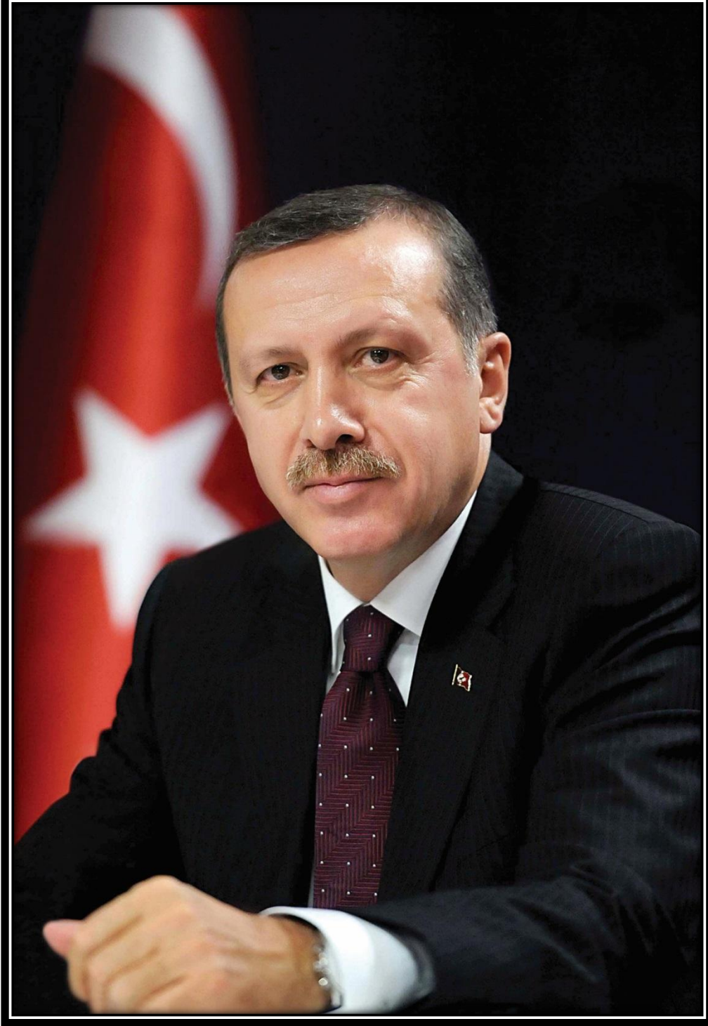
Recep TAYYİP ERDOĞAN Cumhurbaşkanı