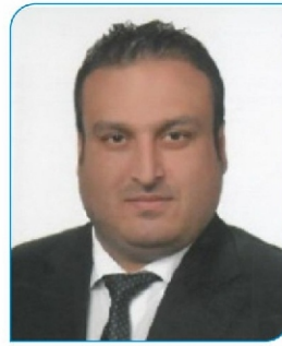
Bora Teryaki Mhp