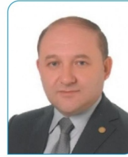
Recep Güleroğlu Mhp