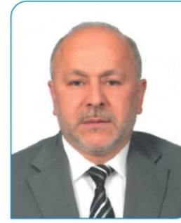
Turan Ordulu Ak Parti