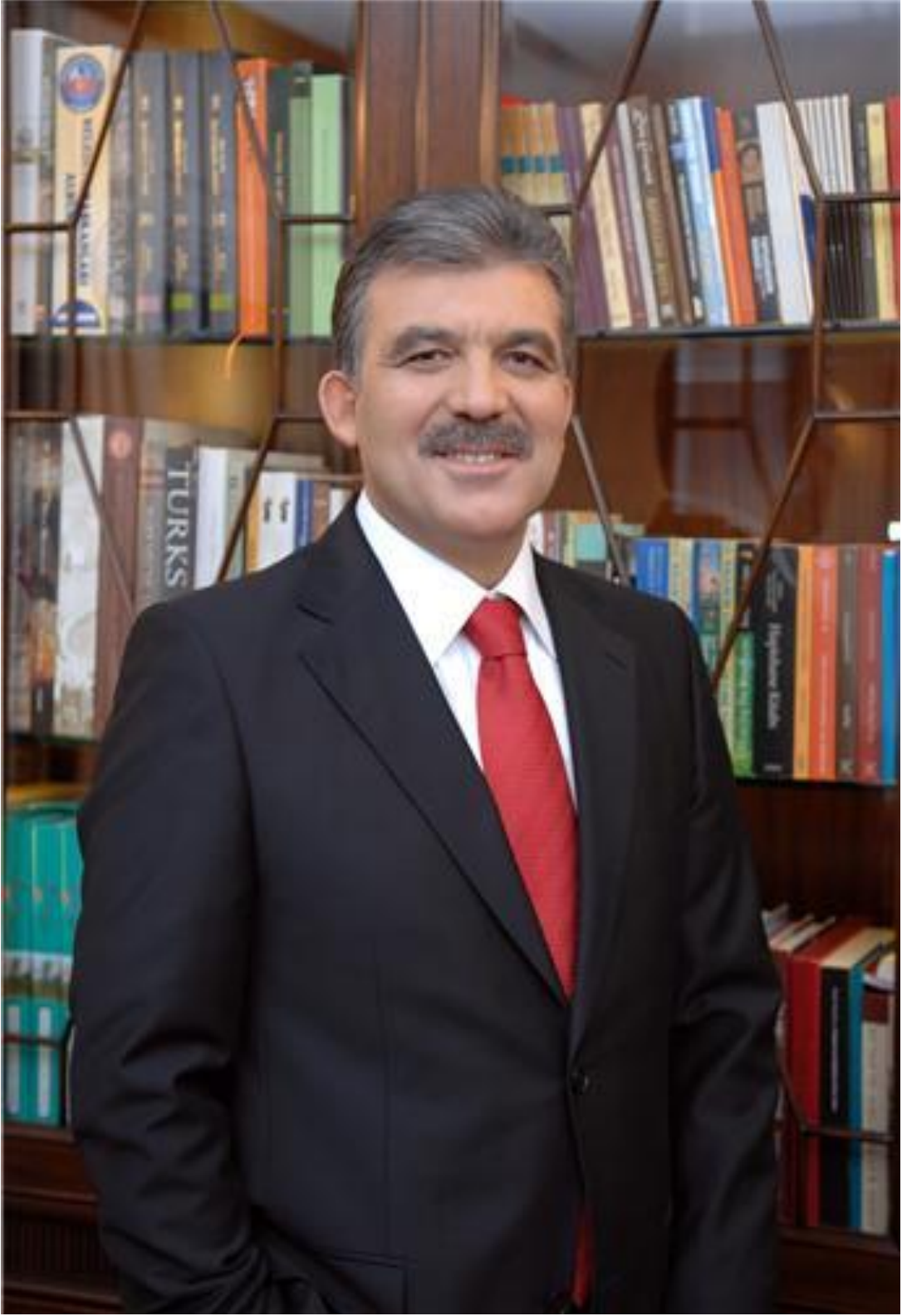
ABDULLAH GÜL CUMHURBAŞKANI