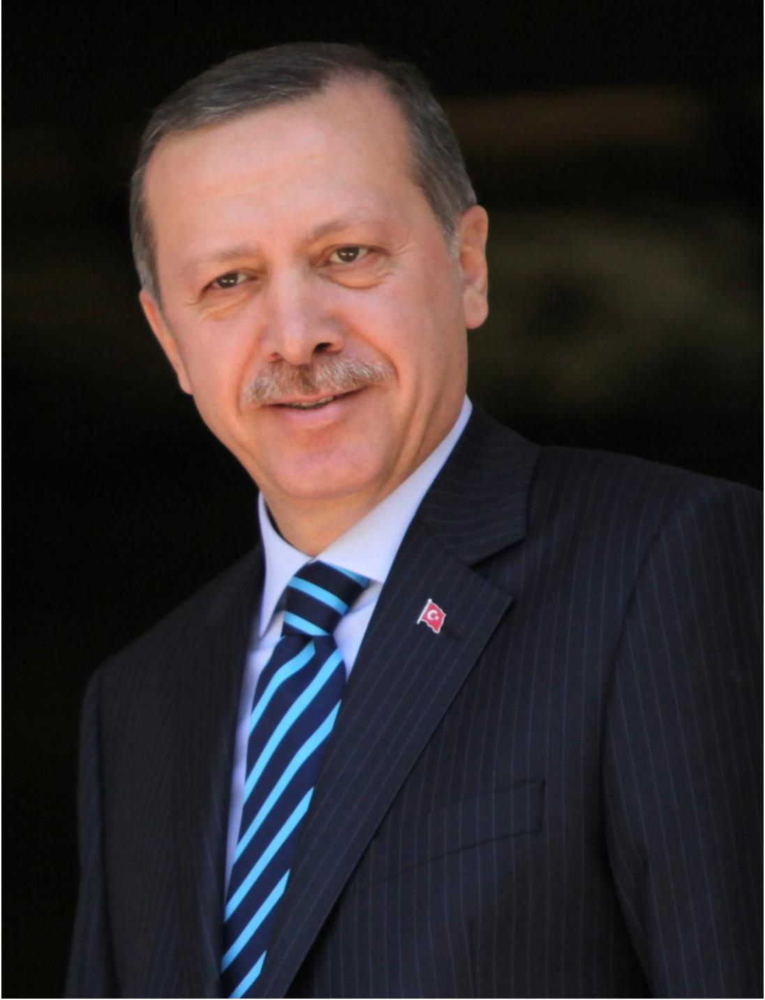
RECEP TAYYİP ERDOĞAN BAŞBAKAN