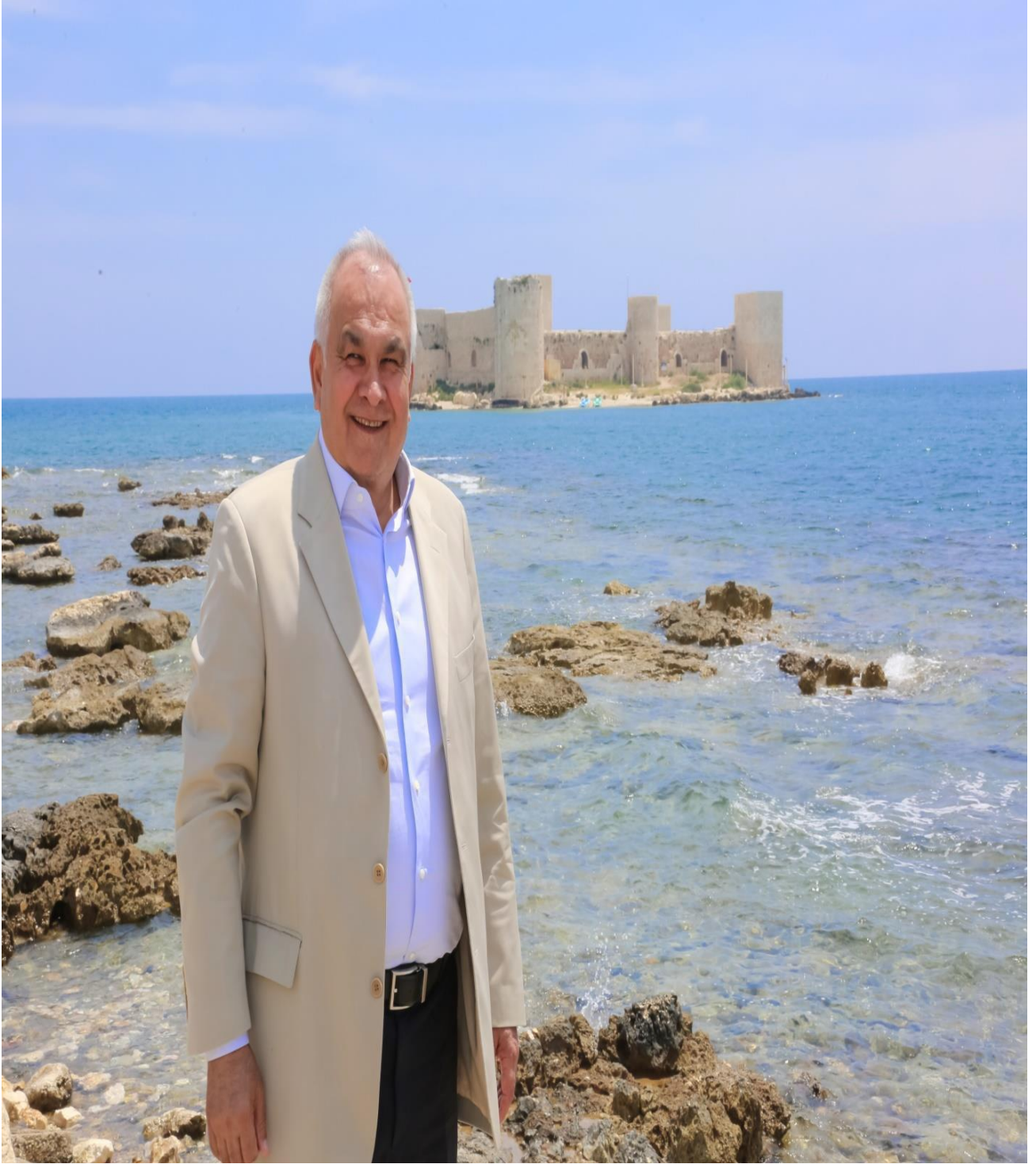
MÜKERREM TOLLU BELEDİYE BAŞKANI