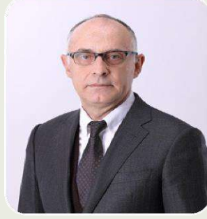
FARUK TÜRKOĞLU AK PARTİ