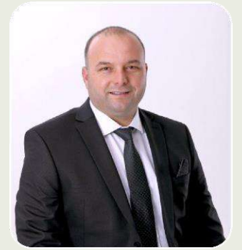
TAYFUN TİMUR AK PARTİ