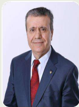
İSMET AKÇAY AK PARTİ