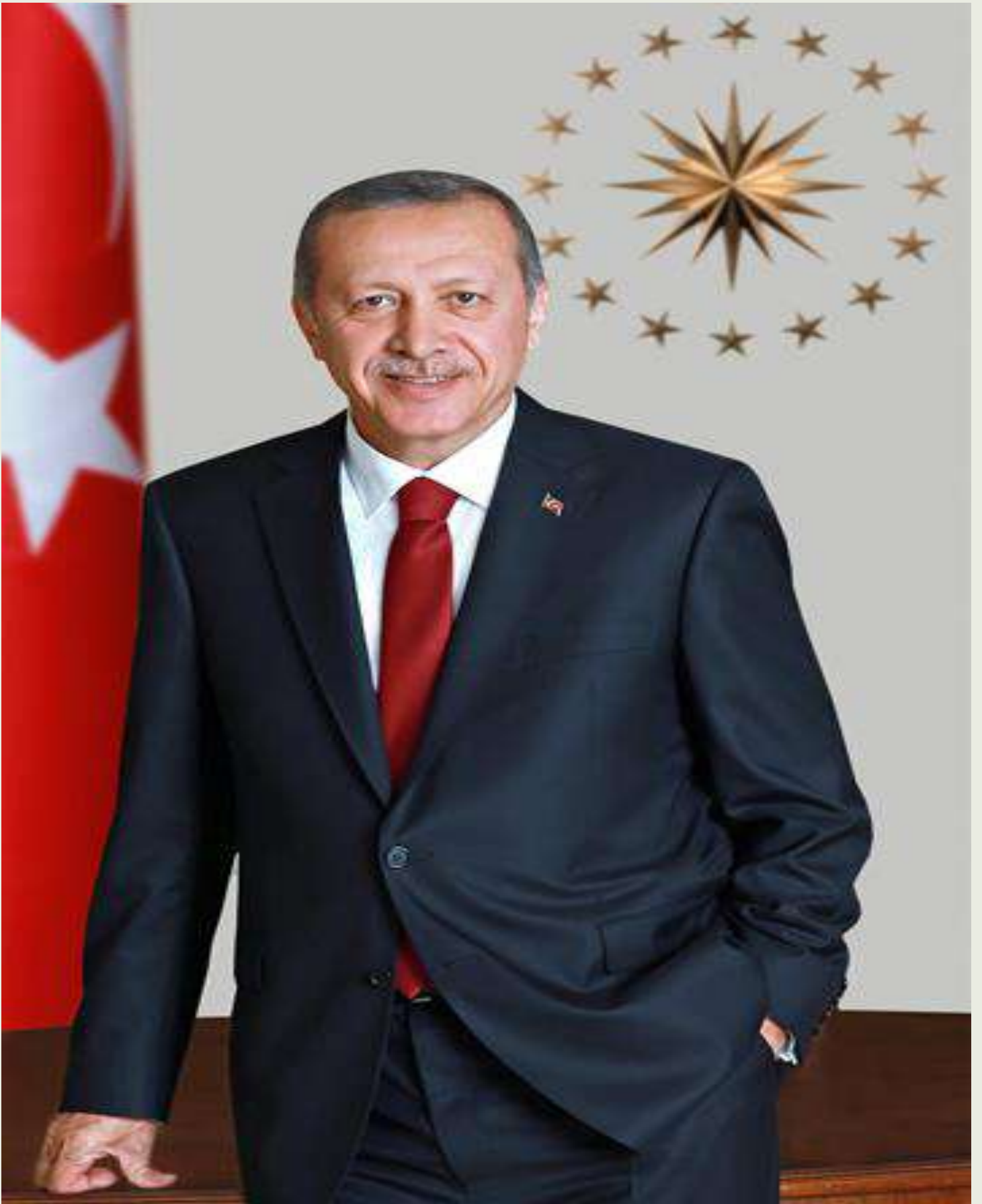
RECEP TAYYİP ERDOĞAN