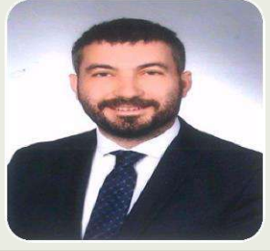
TUFAN AKAN İYİ PARTİ