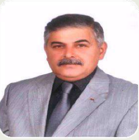
ÇETİN ÇAVDARLI İYİ PARTİ