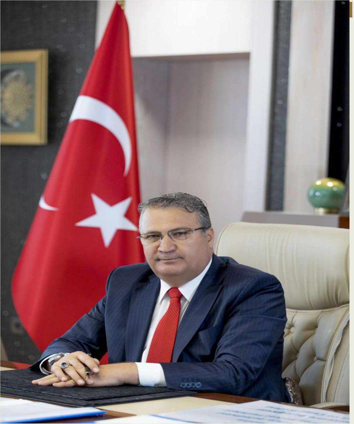
DR.MEHMET ÇERÇİ BELEDİYE BAŞKANI