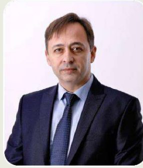
DİLŞAT ULAŞ AK PARTİ