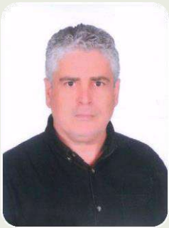
BÜLENT MERSİNLİ CHP