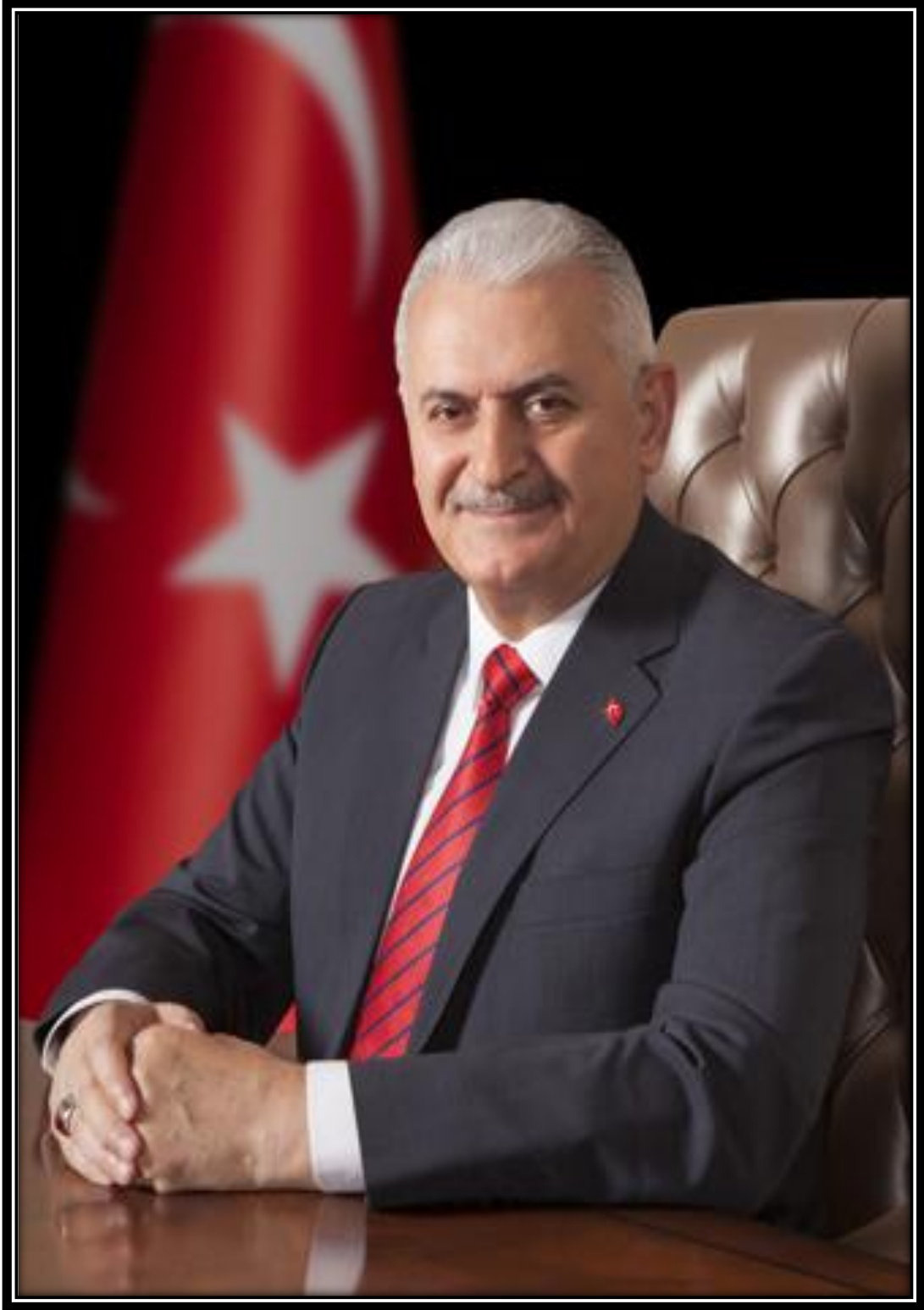
Binali YILDIRIM Başbakan