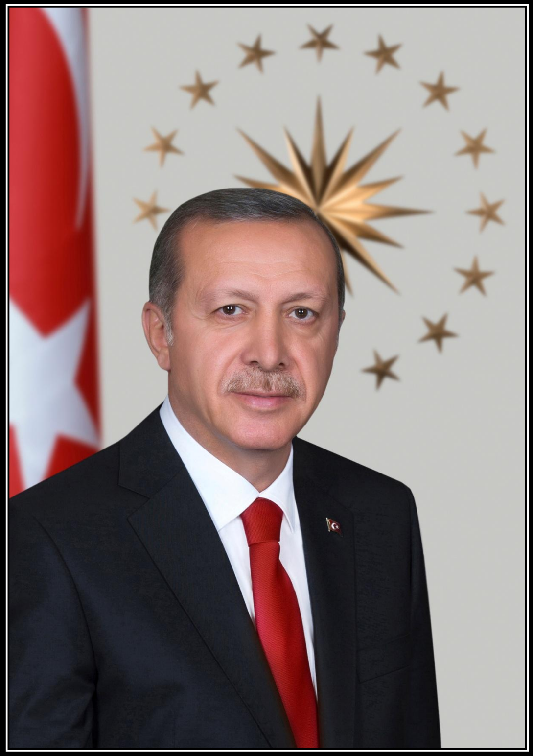
Recep Tayyip ERDOĞAN Cumhurbaşkanı