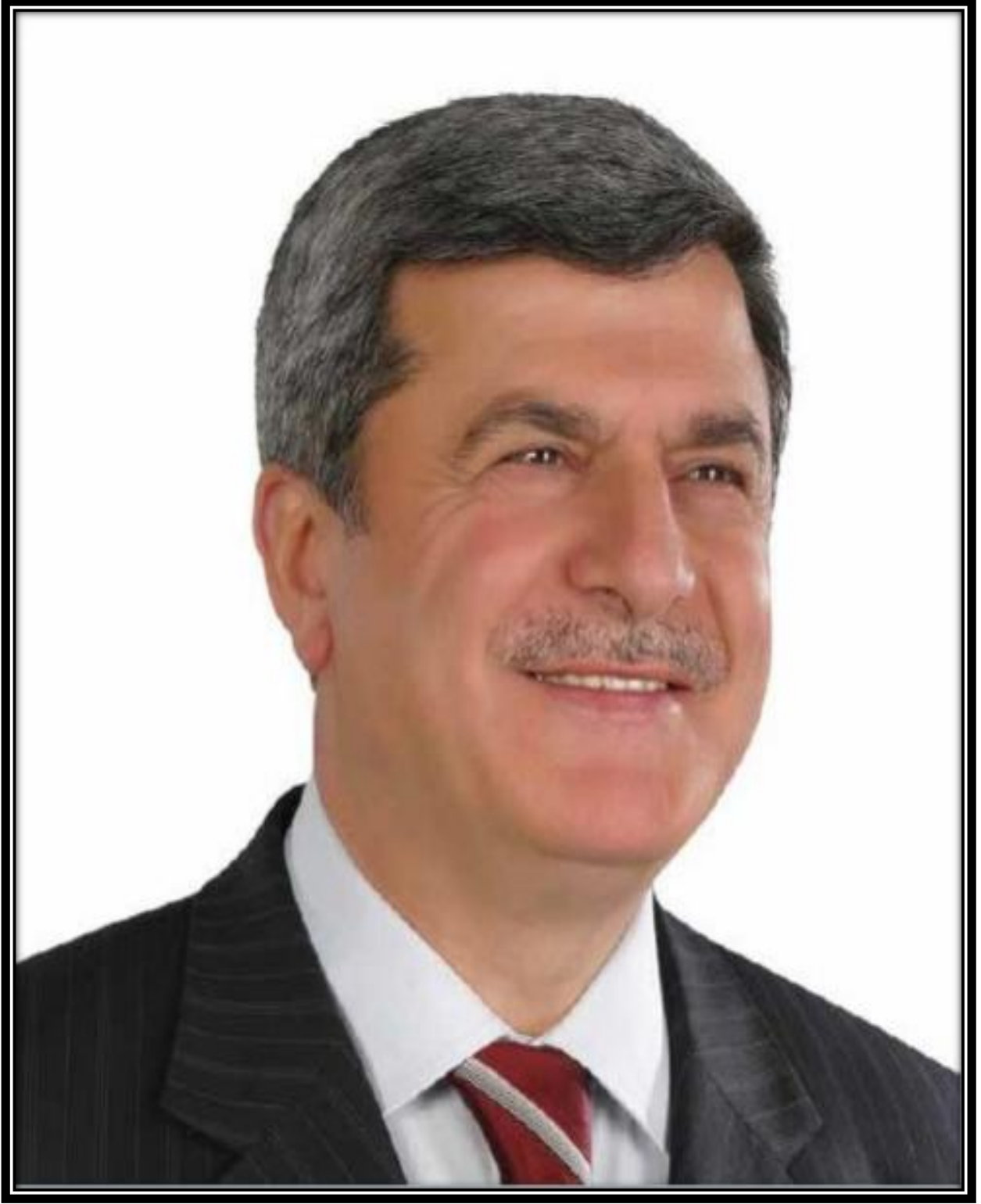
İbrahim KARAOSMANOĐLU Büyükşehir Belediye Başkanı