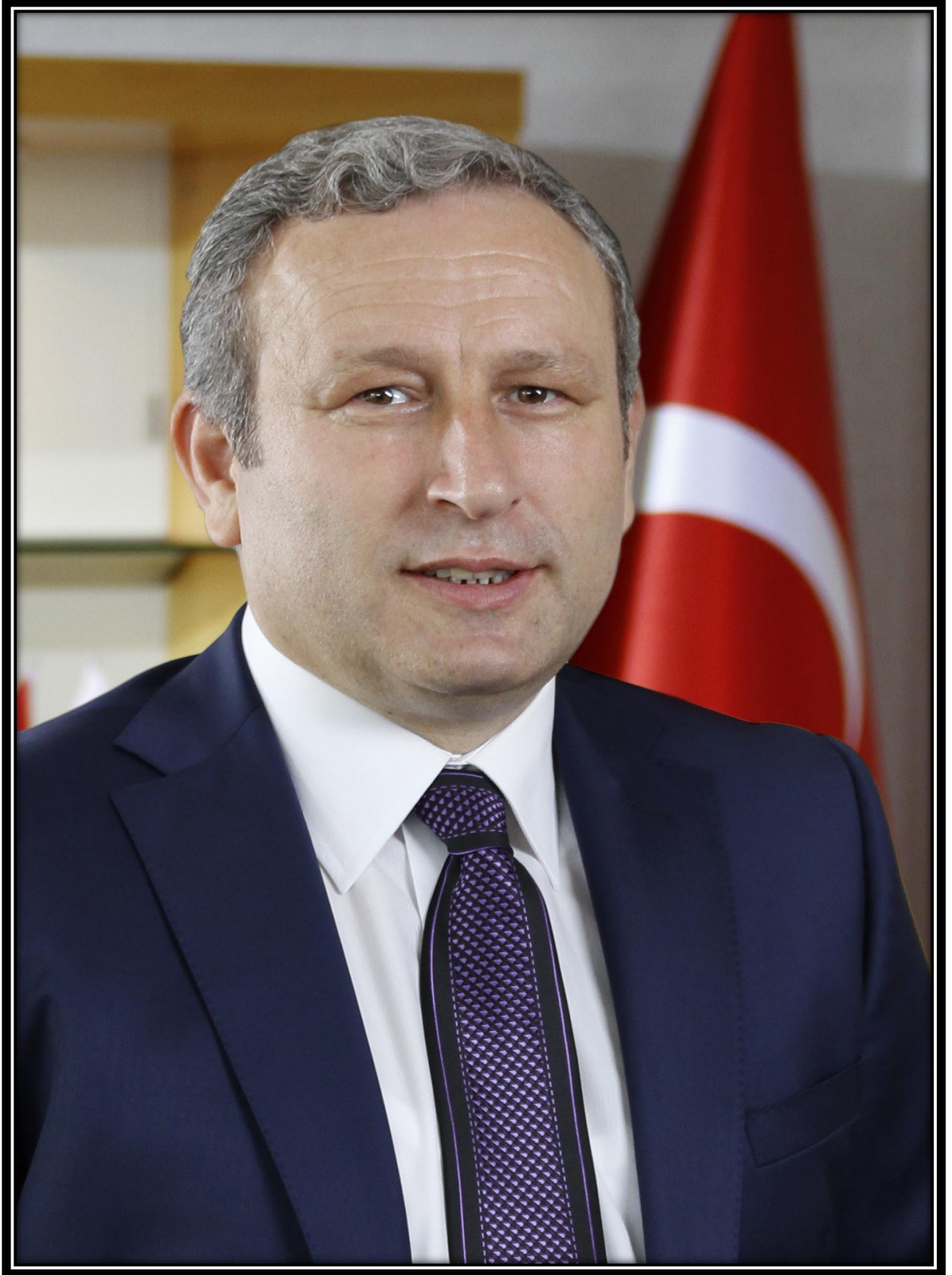
Ali Haydar BULUT Belediye Başkanı