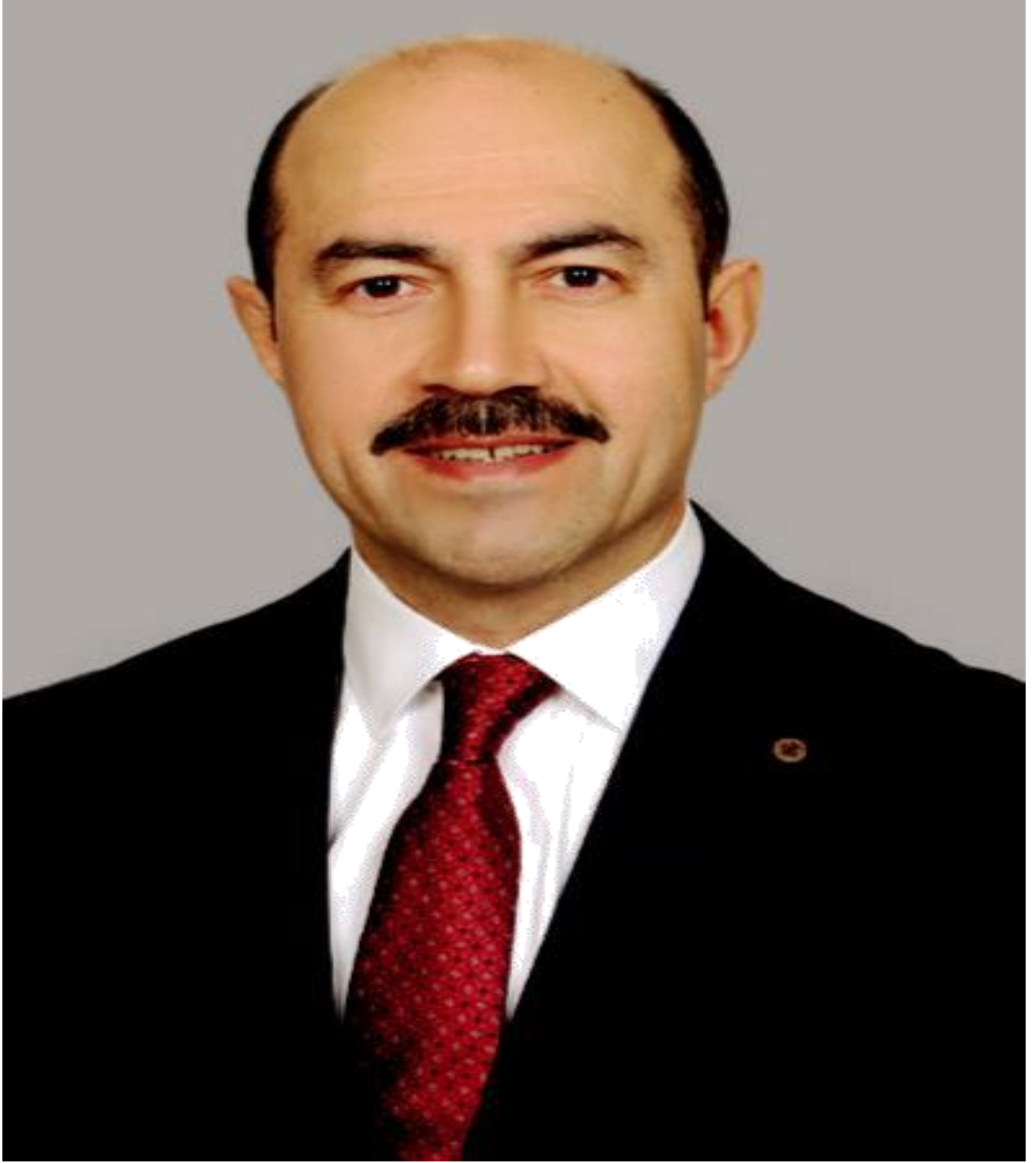
Ali KILIÇ Terme Belediye Başkanı