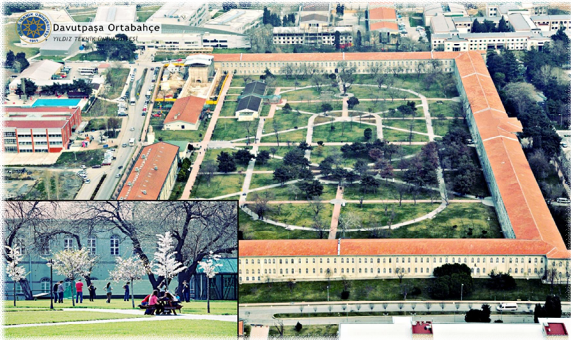
Davutpaşa Yerleşkesi Görünümü