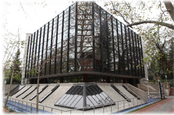
Yıldız Şevket Sabancı Kütüphanesi