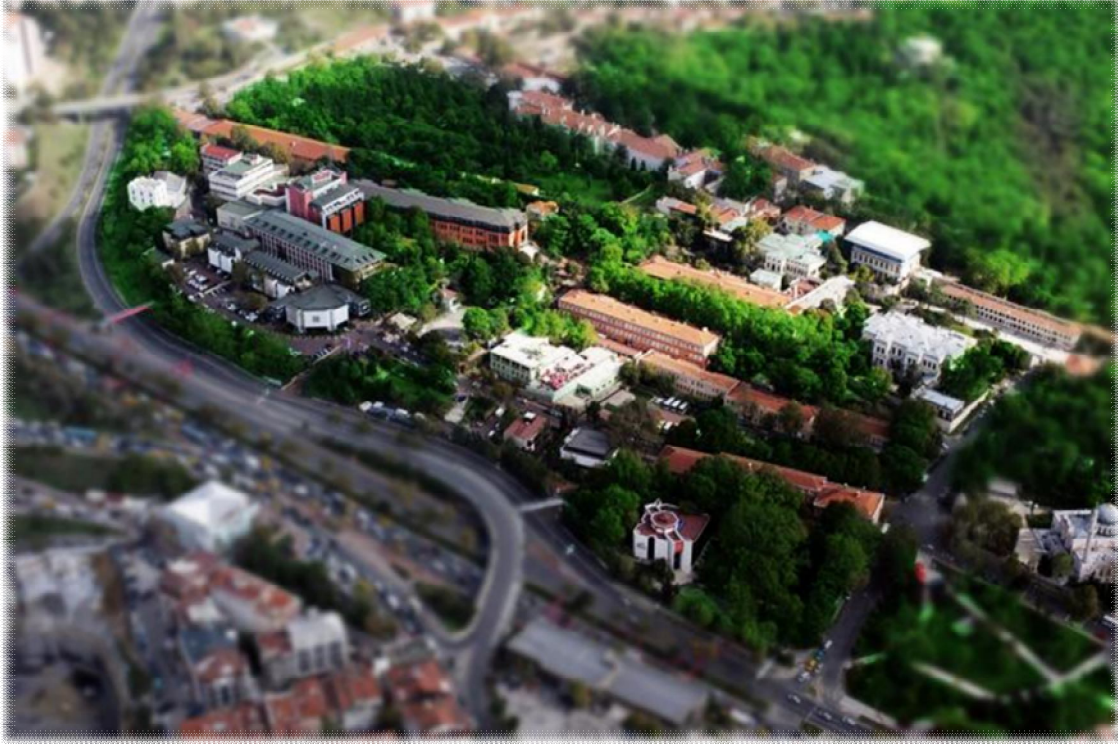
Yıldız Yerleşkesi Görünümü

Üniversitemiz Yıldız Merkez, Davutpaşa, Maslak (Ayazağa) ve Gaziosmanpaşa olmak üzere 4 yerleşkeye sahiptir.