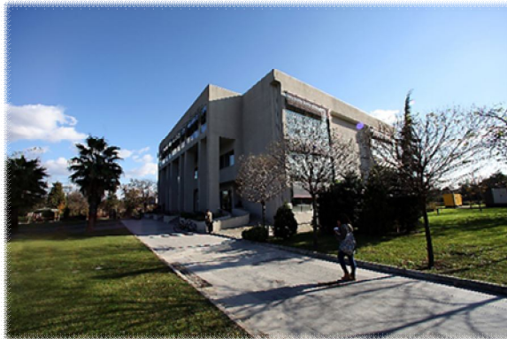
Davutpaşa Merkez Kütüphanesi