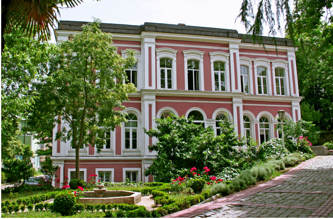
Beşiktaş Merkez Yerleşkesi Çukursaray Binası (F Blok)

izlenmesi ve 5018 sayılı Kamu Mali Yönetimi ve Kontrol Kanununda belirtilen görev ve sorumlulukların yerine getirilmesinden Bakana karşı sorumlu olduğu ve üst yöneticilerin, bu sorumluluğun gereklerini harcama yetkilileri, mali hizmetler birimi ve iç denetçiler aracılığıyla yerine getireceği hüküm altına alınmıştır.