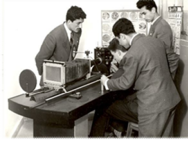
Geçmiş Yıllara Ait YTÜ Fotoğraf Arşivinden Yerleşke Ve Atölye Görünümleri