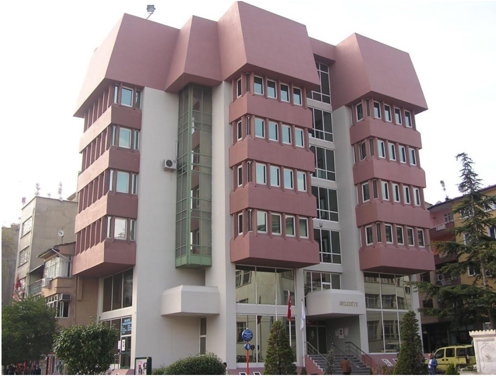
Orhangazi Belediyesi Ana Hizmet Binası

Kurtuluş Savaşı sonrasında ilçemiz tamamen yakılıp yıkıldığı için. Orhangazi'nin 1893 yılında ilçe olmasına dayanılarak, Belediyenin de aynı tarihte kurulduğu kabul edilmektedir. Buna karşılık, ilçede belediye örgütünün daha önceden kurulduğuna ilişkin duyular da vardır.Yapılan araştırmalar sonucunda Orhangazi'nin ilk Belediye Başkanının 1884-1885 yıllarında görev yapan Mehmet Efendi olduğu anlaşılmaktadır.