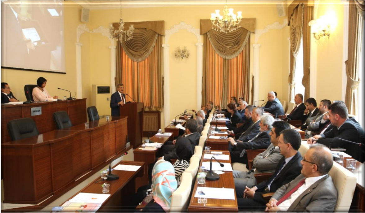
Zeytinburnu Belediye Meclisi

Zeytinburnu Belediye Meclisi 37 üyeden teşekkül eder. Bu üyelerin 26 AK PARTİ' den; 11 de CHP'den seçilen üyelerdir.